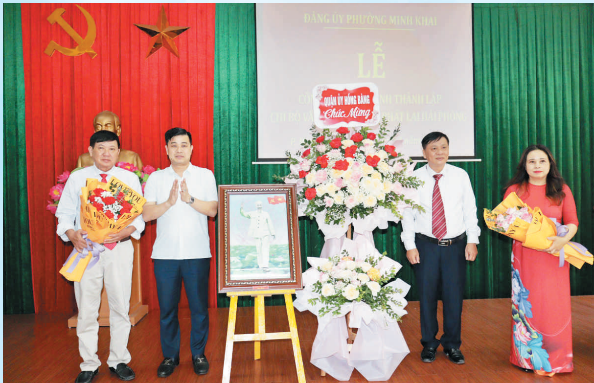
Thực hiện Nghị quyết số 28-NQ/TU ngày 10/11/2009 của Ban Thường vụ Thành ủy về "Xây dựng, củng cố và phát triển tổ chức Đảng, đoàn thể trong các loại hình doanh nghiệp ngoài nhà nước, hợp tác xã, đơn vị sự nghiệp ngoài công lập", Đảng ủy phường Minh Khai tổ chức Lễ công bố Quyết định thành lập Chi bộ Văn phòng Thừa phát lại Hải Phòng