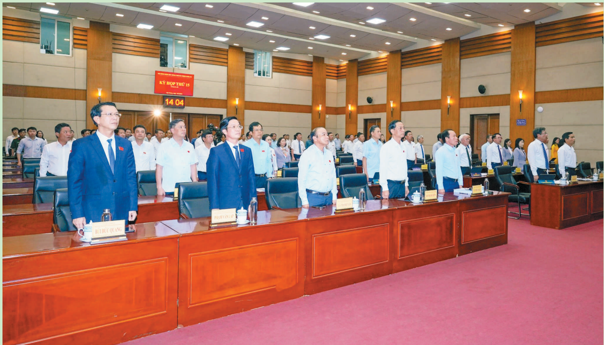
Các đại biểu làm lễ chào cờ tại Kỳ họp Kỳ họp thứ 15 (kỳ họp chuyên đề) HĐND thành phố khóa XVI, nhiệm kỳ 2021 - 2026. Kỳ họp thông qua 7 Nghị quyết góp phần thúc đẩy các lĩnh vực kinh tế - xã hội thành phố phát triển