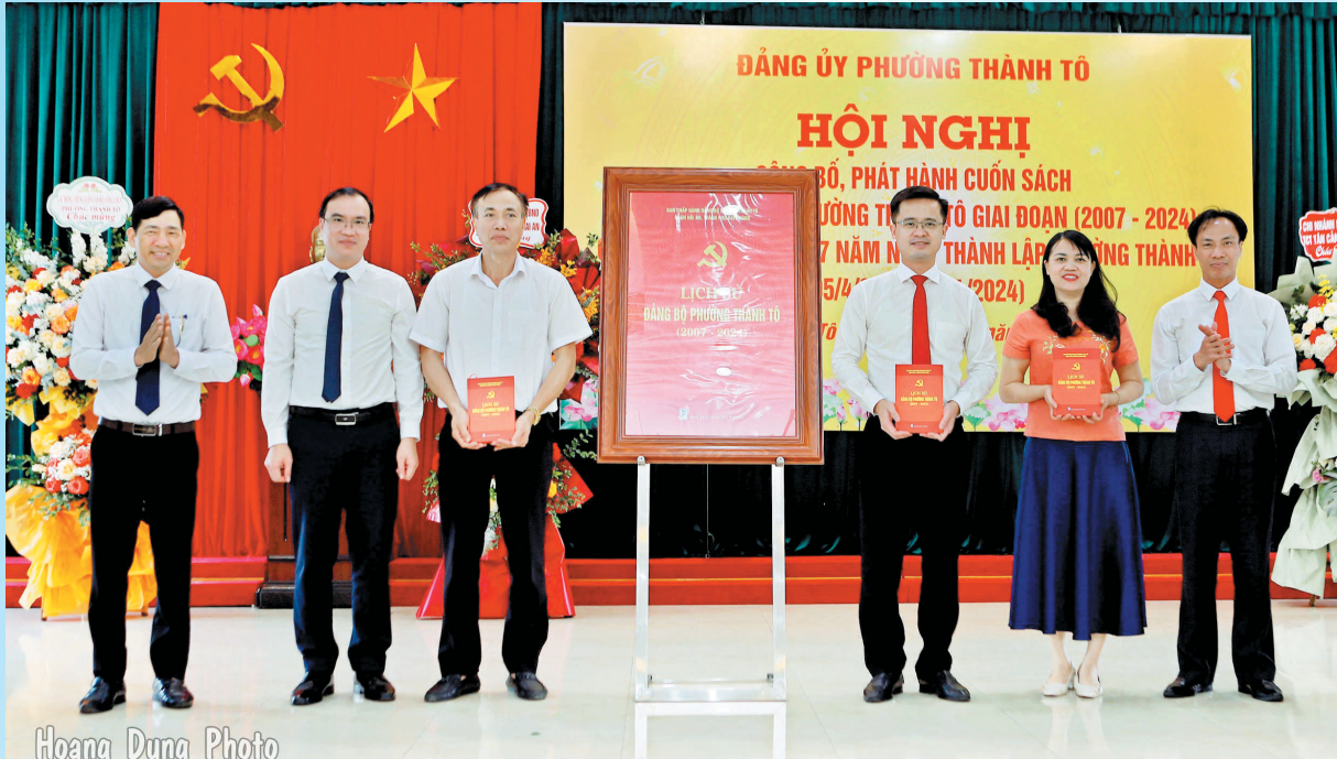
Đảng bộ phường Thành Tô, quận Hải An tổ chức ra mắt cuốn Lịch sử Đảng bộ phường Thành Tô (2007-2024) nhân Kỷ niệm 17 năm Ngày thành lập phường Thành Tô (05/4/2007-05/4/2024)