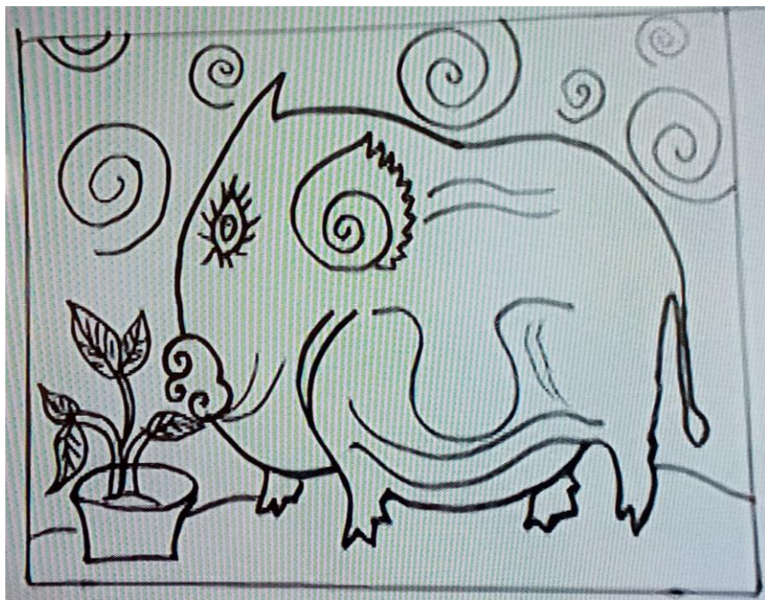
Bước 1: Vẽ Hình