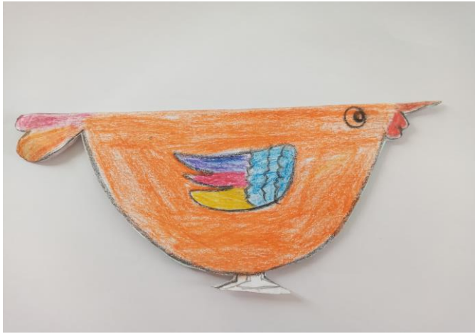
Bước 1: Vẽ hình và tô màu.