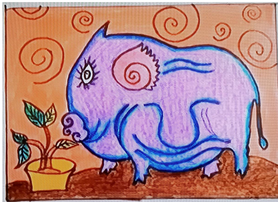
Bước 2: Vẽ Màu