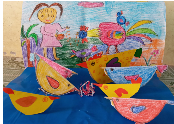
Bước 3: Sắp xếp thành tranh nhóm.