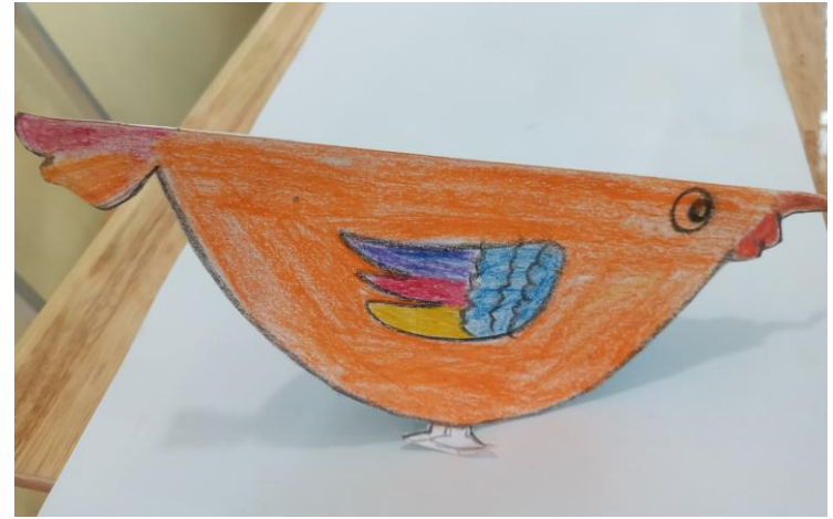
Bước 2: Cắt rời