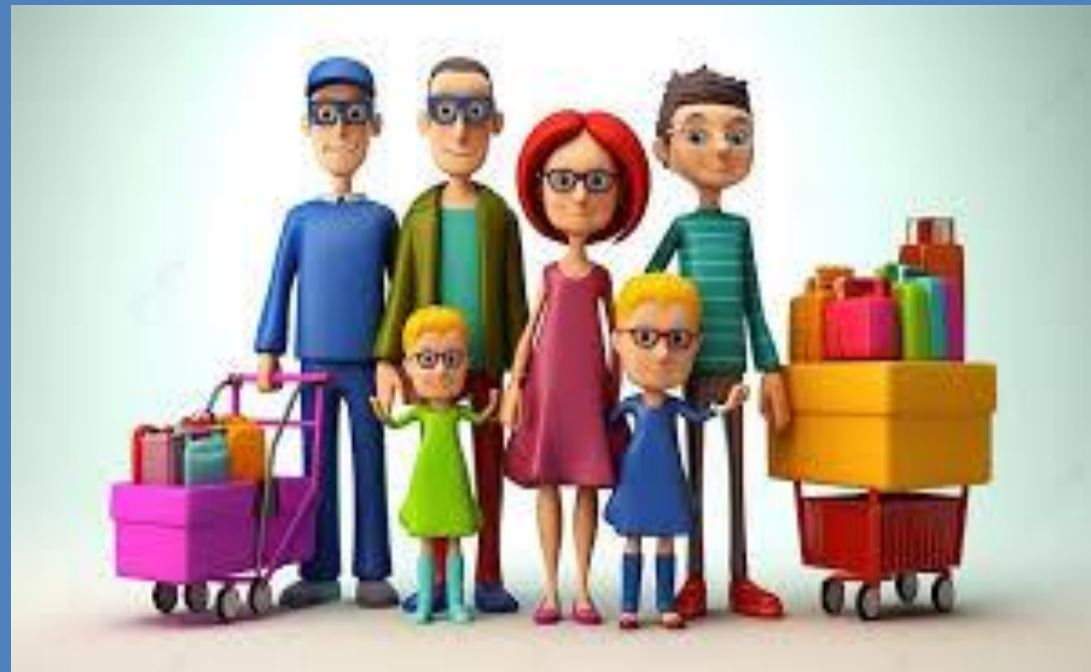
Nhánh 3: Đồ dùng gia đình