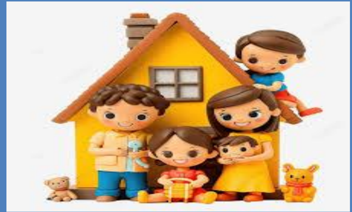
Nhánh 2: Dự án ngôi nhà ước mơ