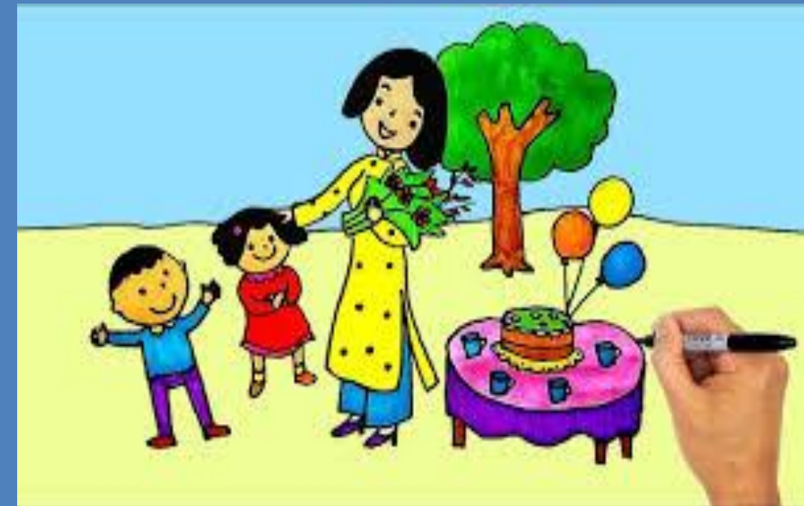
Nhánh 4: Ngày hội của cô giáo