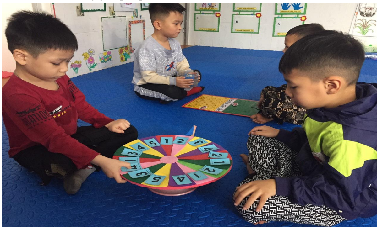
Trò chơi : Vòng quay kì diệu (Hình 10)