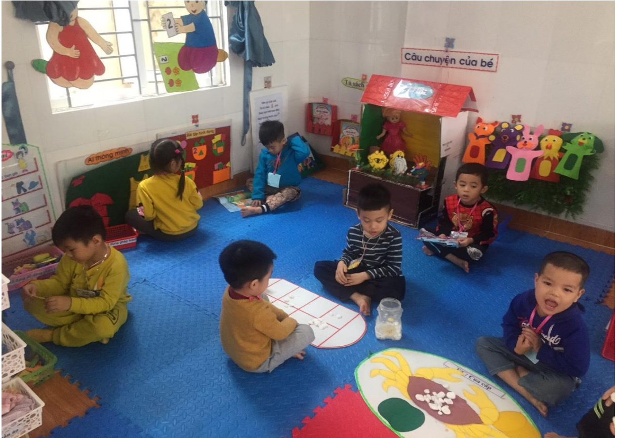
Hình ảnh bé hoạt động tại góc học tập (Hình 11)