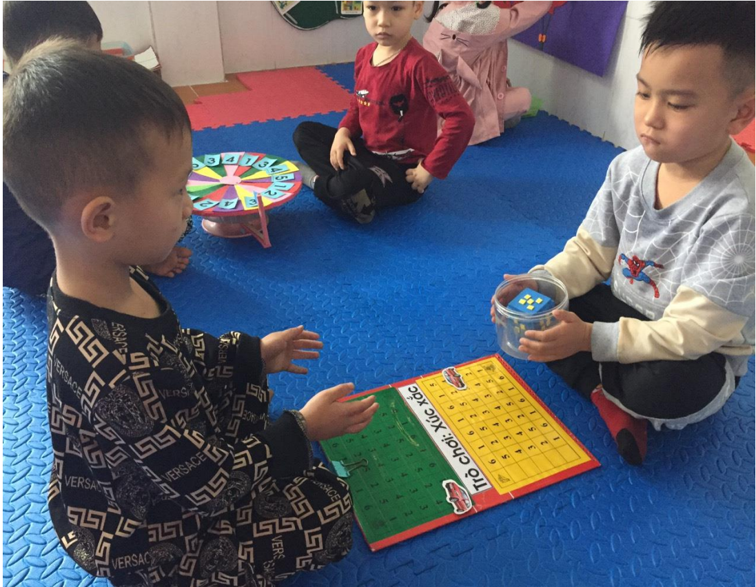
Trò chơi : Xúc xắc (Hình 1)