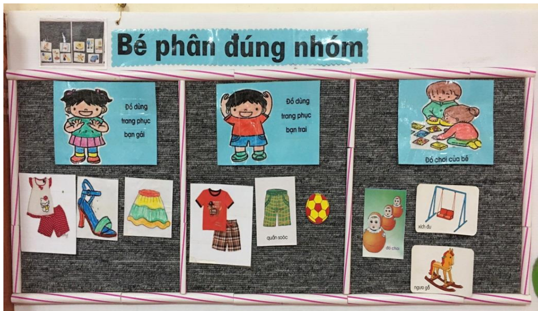
Trò chơi: Phân loại đồ dùng đồ chơi của bé (Hình 2)