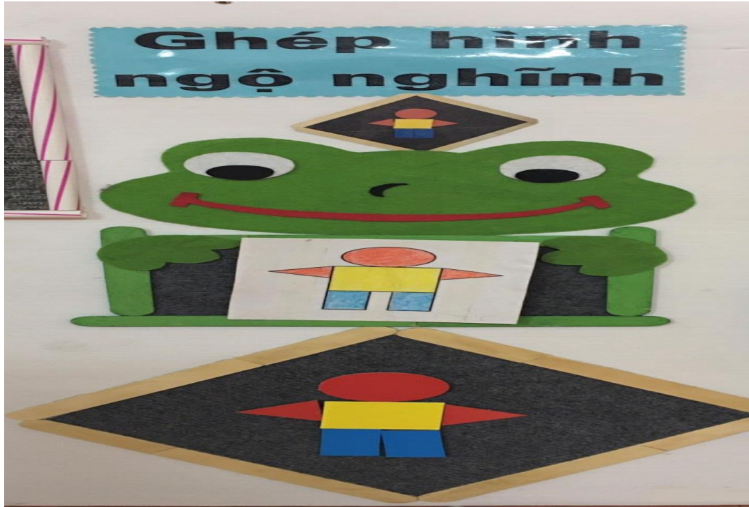
Trò chơi: Ghép hình bé trai, bé gái (Hình 7)

Sáng kiến: Giải pháp sáng tạo một số trò chơi theo quan điểm lấy trẻ làm trung tâm nhằm giúp trẻ 4-5 tuổi tham gia tích cực trong góc học tập tại trường mầm non Thái Sơn 1”