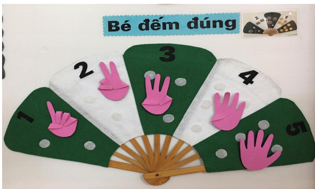
Trò chơi: Bé đếm đúng (Hình 6)