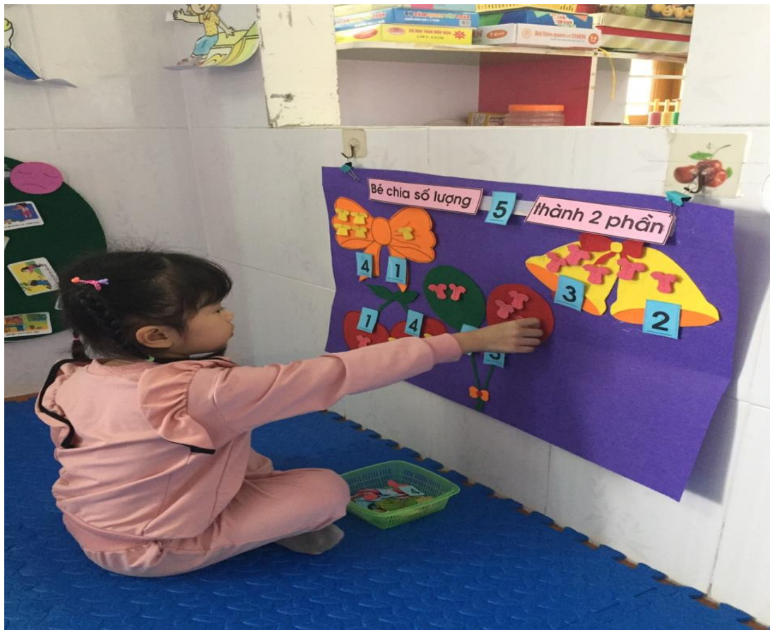
Trò chơi : Bé chia số lượng thành 2 phần (Hình 8)