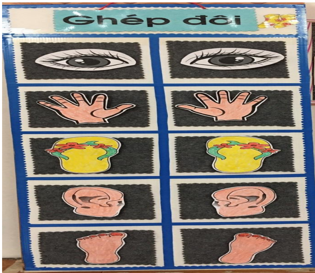
Trò chơi: Ghép đôi (Hình 3)

Sáng kiến: Giải pháp sáng tạo một số trò chơi theo quan điểm lấy trẻ làm trung tâm nhằm giúp trẻ 4-5 tuổi tham gia tích cực trong góc học tập tại trường mầm non Thái Sơn 1”