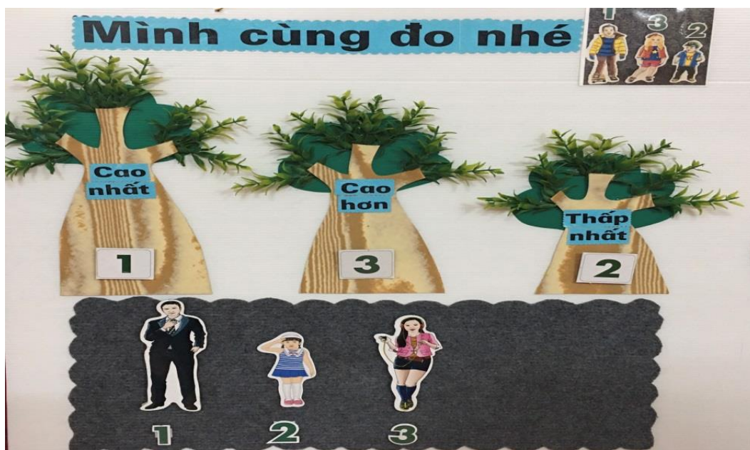
Trò chơi: Bé tập đo (Hình 5)

Sáng kiến: Giải pháp sáng tạo một số trò chơi theo quan điểm lấy trẻ làm trung tâm nhằm giúp trẻ 4-5 tuổi tham gia tích cực trong góc học tập tại trường mầm non Thái Sơn 1”