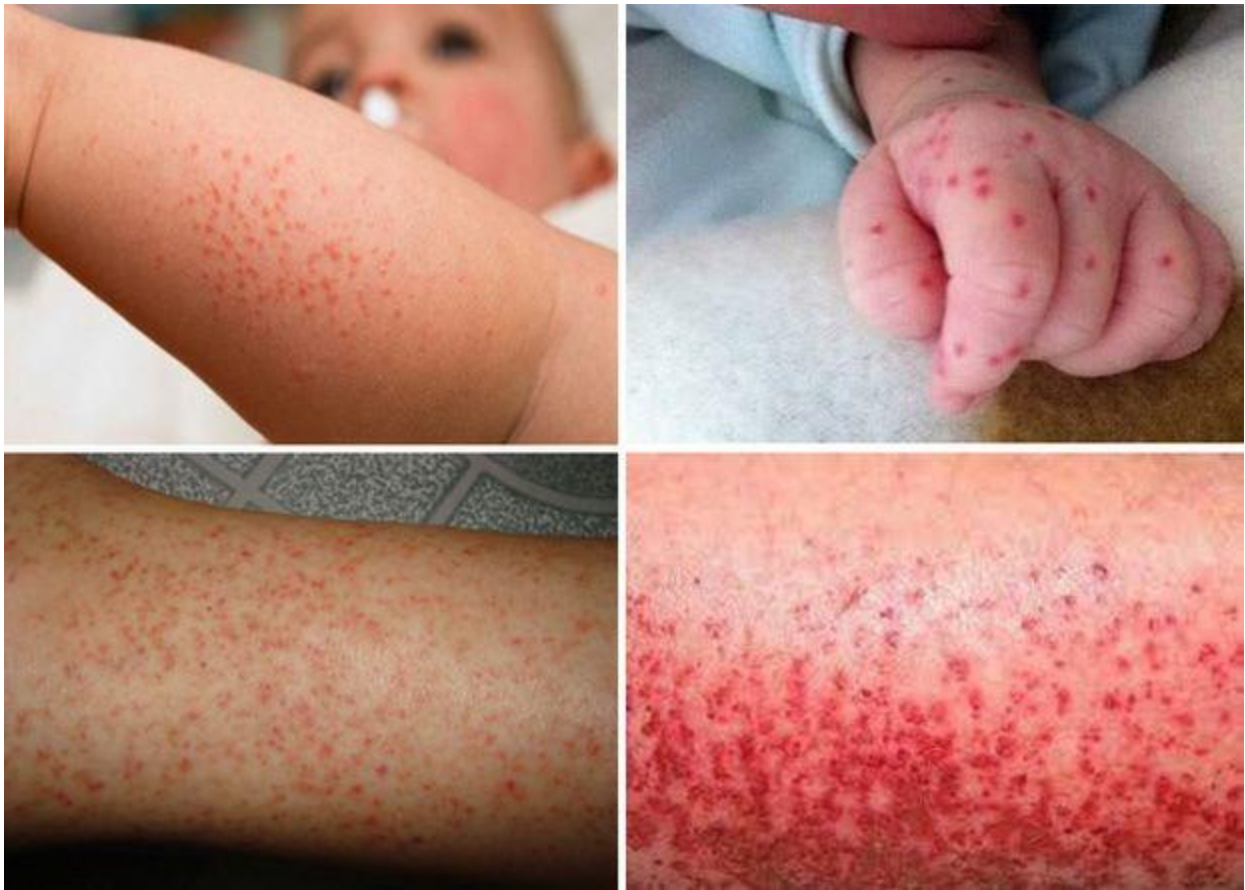
Sốt cao kèm theo dấu hiệu phát ban