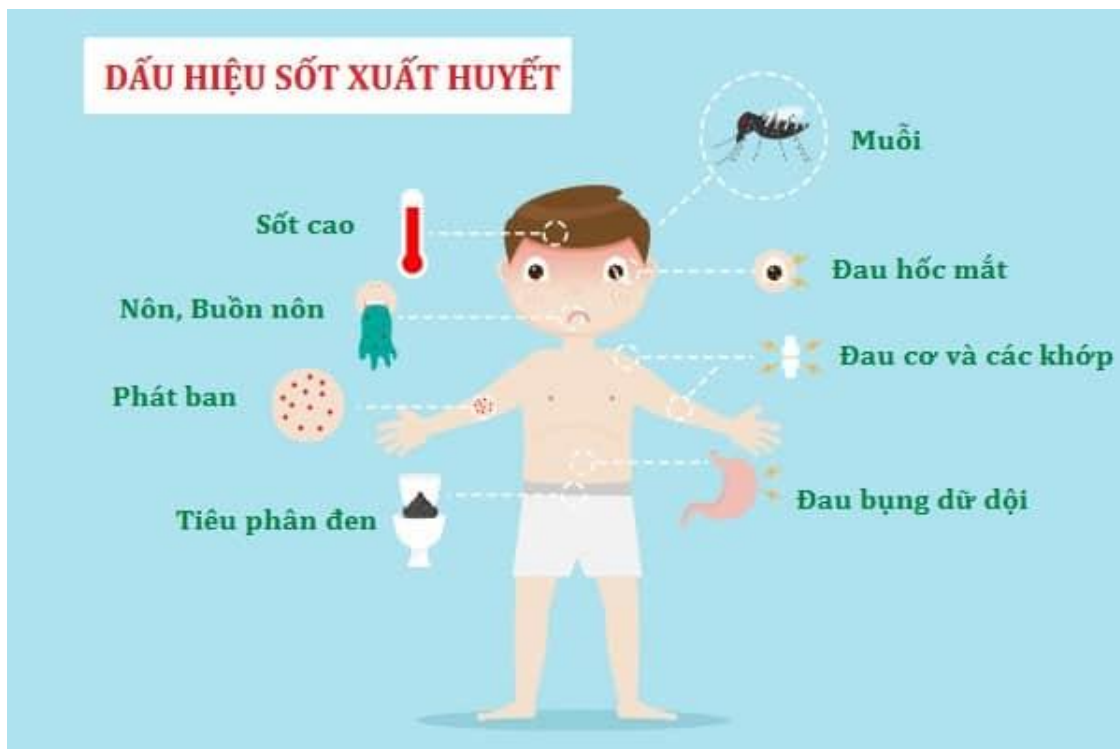
Dấu hiệu sốt xuất huyết