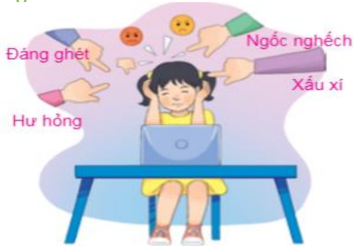
Hình 8. Tình huống An gặp phải

Trong khi truy cập Internet, bạn An vô tình vào một trang web trò chuyện không phù hợp. Em hãy quan sát Hình 8 và cho biết bạn An đã gặp rắc rối gì?