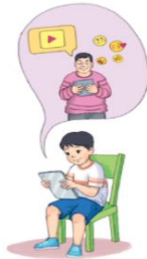
Hình 9. Kẻ xấu dụ dỗ