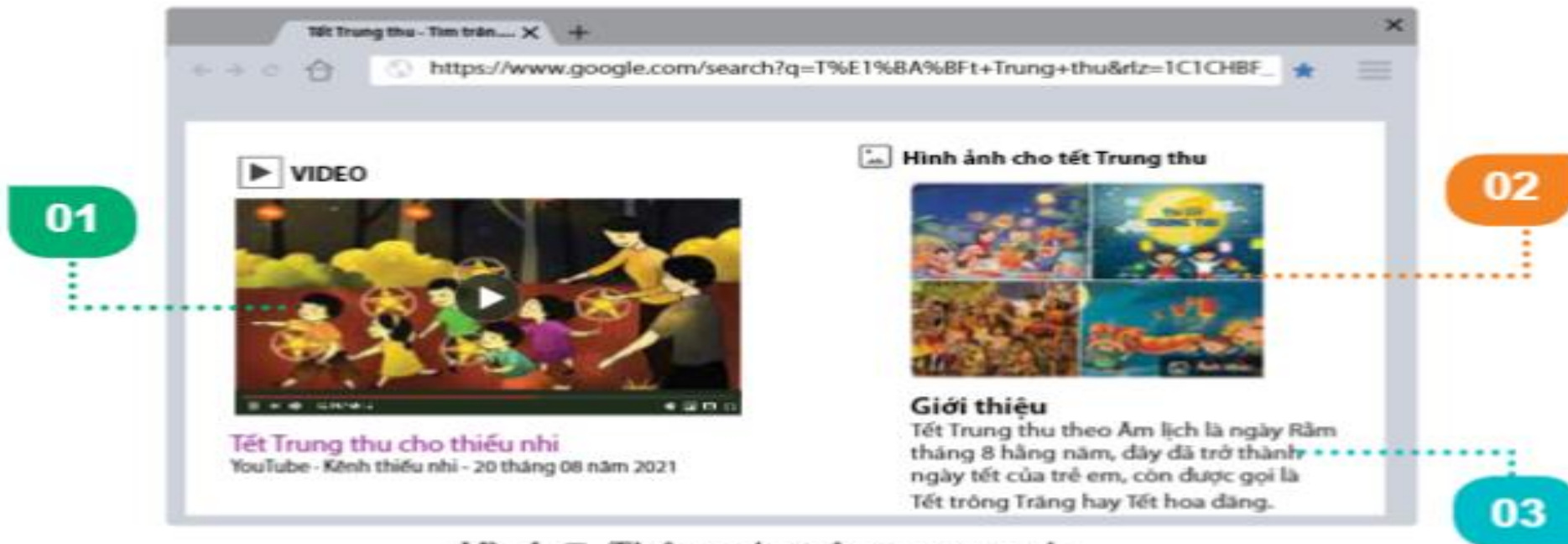
Hình 7. Thông tin trên trang web

Em hãy quan sát trang web ở Hình 7 và cho biết các vị trí được đánh số thể hiện thông tin thuộc dạng nào ?