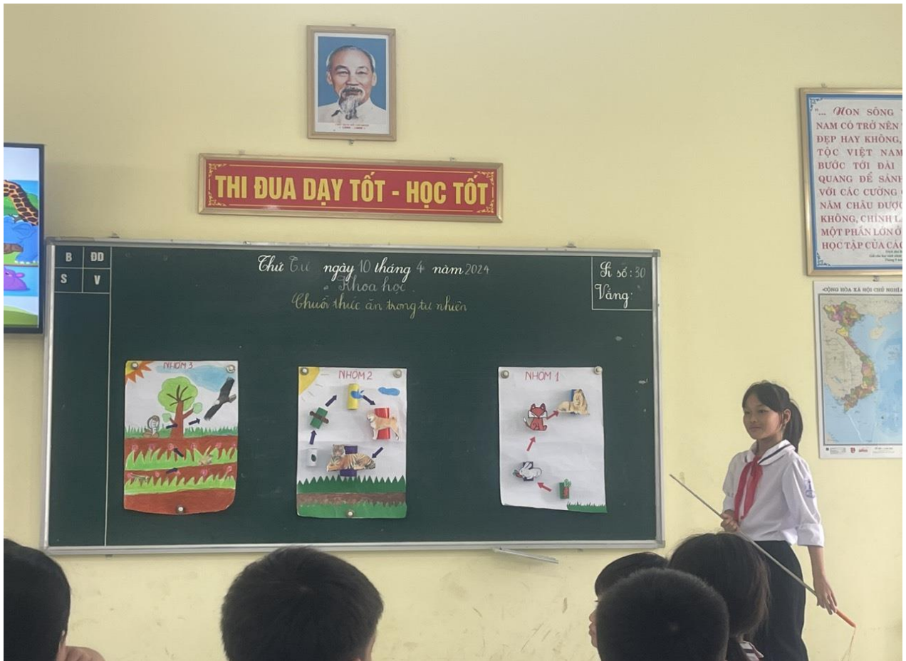
Các nhóm chia sẻ, thảo luận