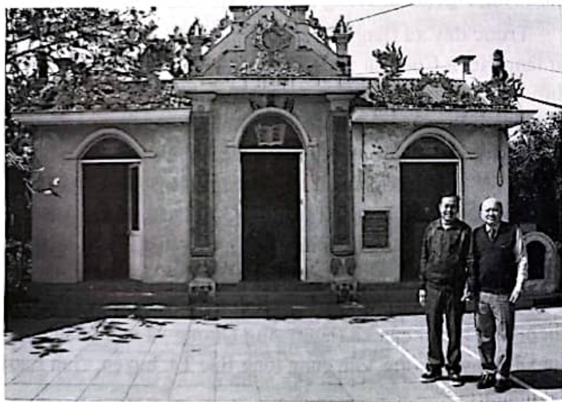
Tác giả (phải) và Trưởng Ban Quản lý đền Thái Giám tại thôn Phương Tường, xã Hùng Tiến, huyện Vĩnh Bảo, Hải Phòng.