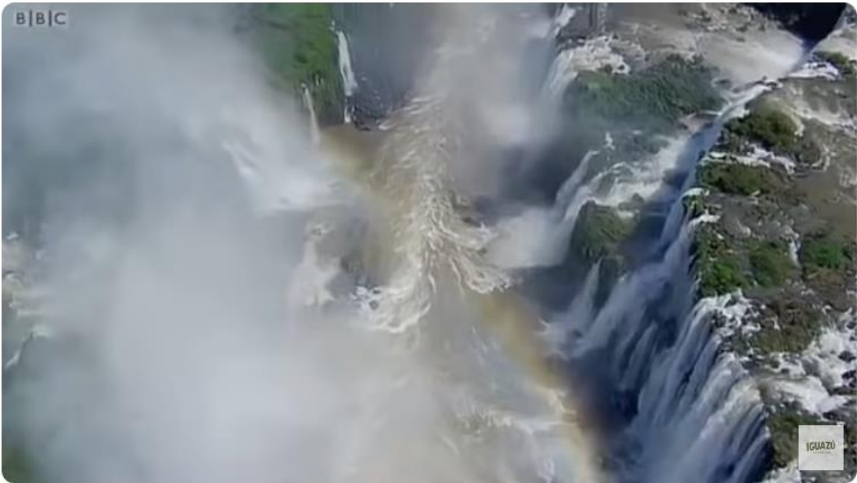
Iguazú Falls - BBC Nature. This is Planet Earth