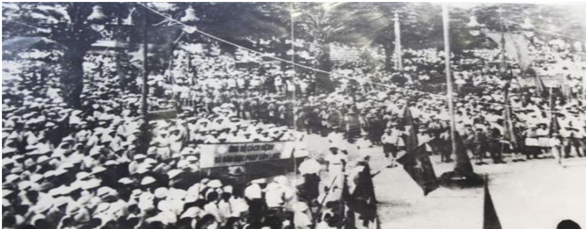
Cuộc mít tinh khởi nghĩa giành chính quyền tại Nhà hát lớn Hải Phòng, ngày 23-8-1945

b. Nội dung: HS dưới sự hướng dẫn của GV xem một số tư liệu, hình ảnh lịch sử của để trả lời các câu hỏi theo yêu cầu của giáo viên.