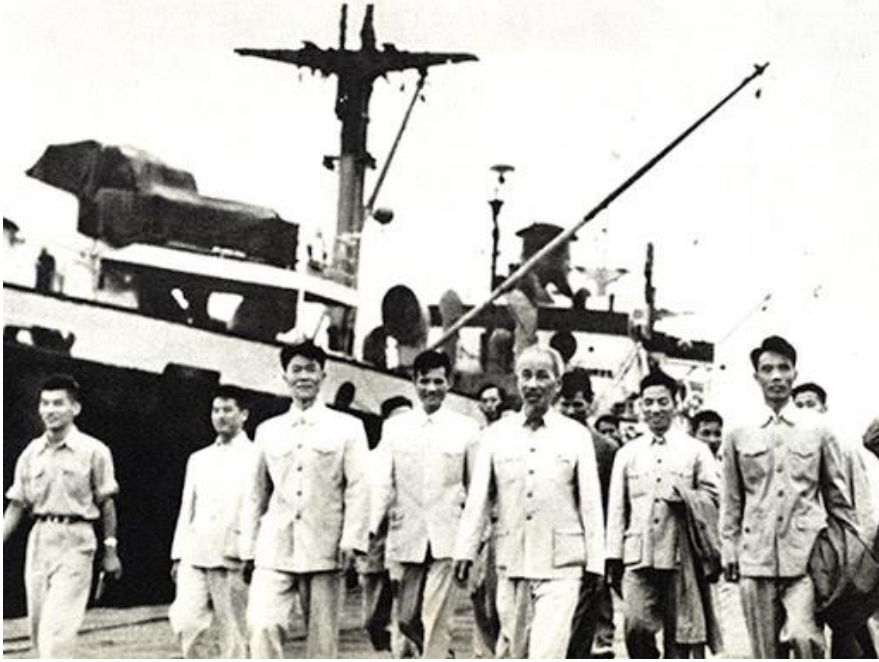
Chủ tịch Hồ Chí Minh về thăm cảng Hải Phòng năm 1962

• Câu hỏi: Khi nào Nhà máy Đóng tàu Hải Phòng được khởi công xây dựng?