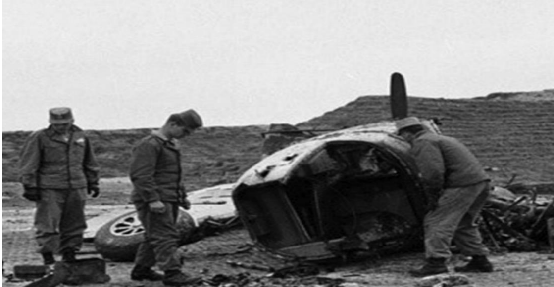
Những xác phi cơ bị phá trong sân bay Cát Bi, ngày 7-3-1954. Ảnh tư liệu

GV mở rộng cung cấp thêm kiến thức liên quan đến nội dung bài học: Gv yêu cầu học sinh về nhà tìm hiểu vào đường link trang web :