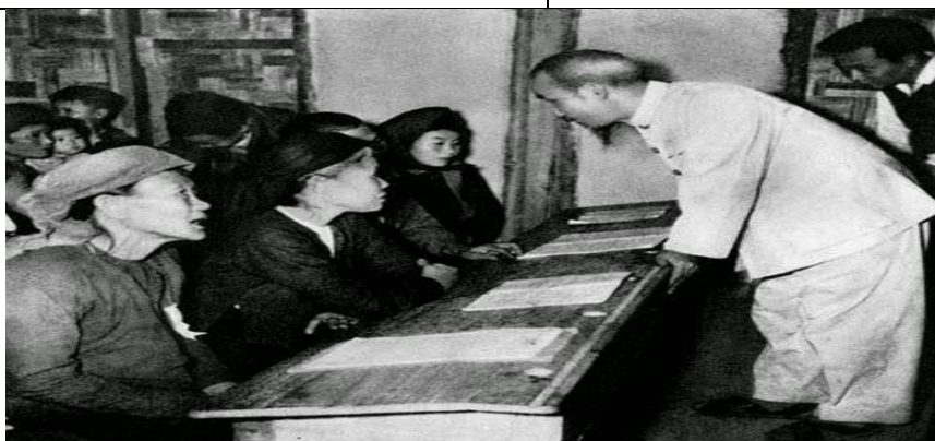
Diệt "giặc đói"

c. Sản phẩm học tập: HS huy động, kết nối kiến thức vốn có với bài học.