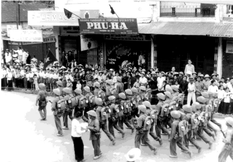
Nhân dân Hải Phòng chào đón bộ đội vào giải phóng thành phố (13-5-1955)