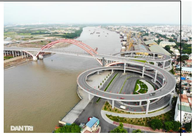
Cầu Hoàng Văn Thụ