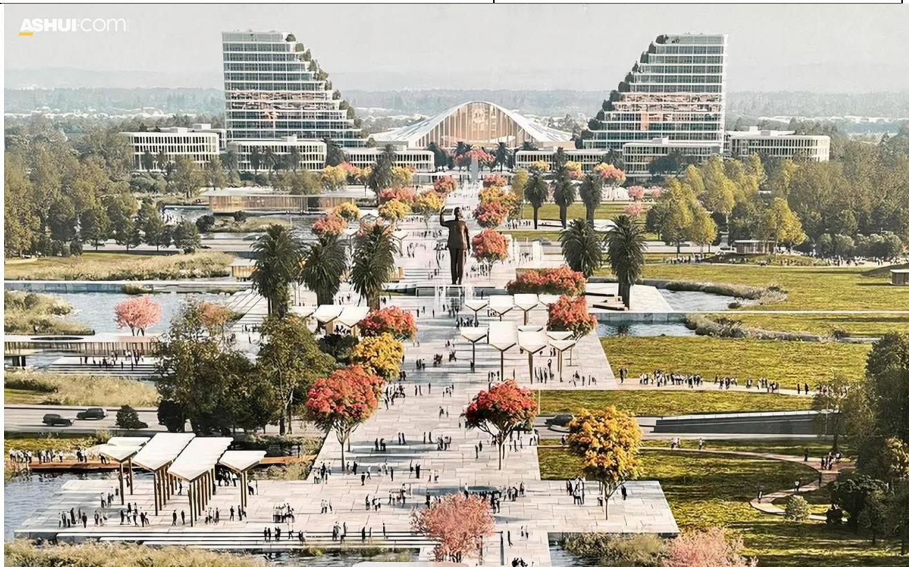
Trung tâm Chính trị - Hành chính Hải Phòng

c. Sản phẩm học tập: HS huy động, kết nối kiến thức vốn có với bài học.