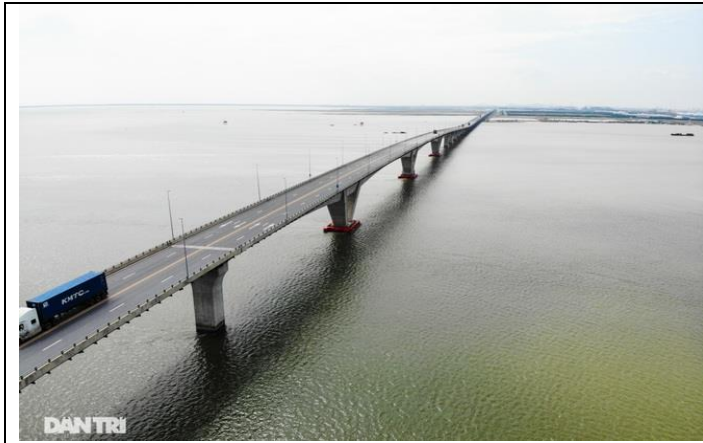
Cầu Tân Vũ- Lạc Huyện