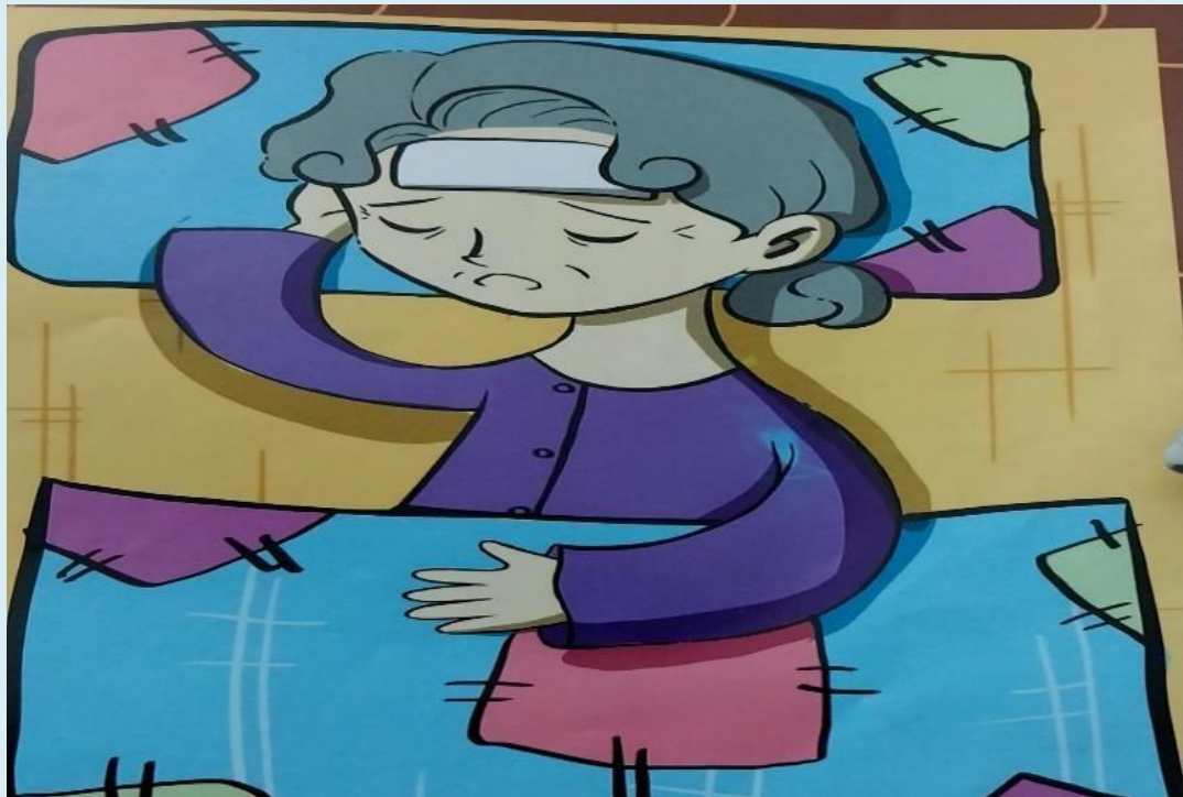
Hình ảnh bà của Tích Chu ốm nhưng cậu mãi chơi, không lo lắng cho bà