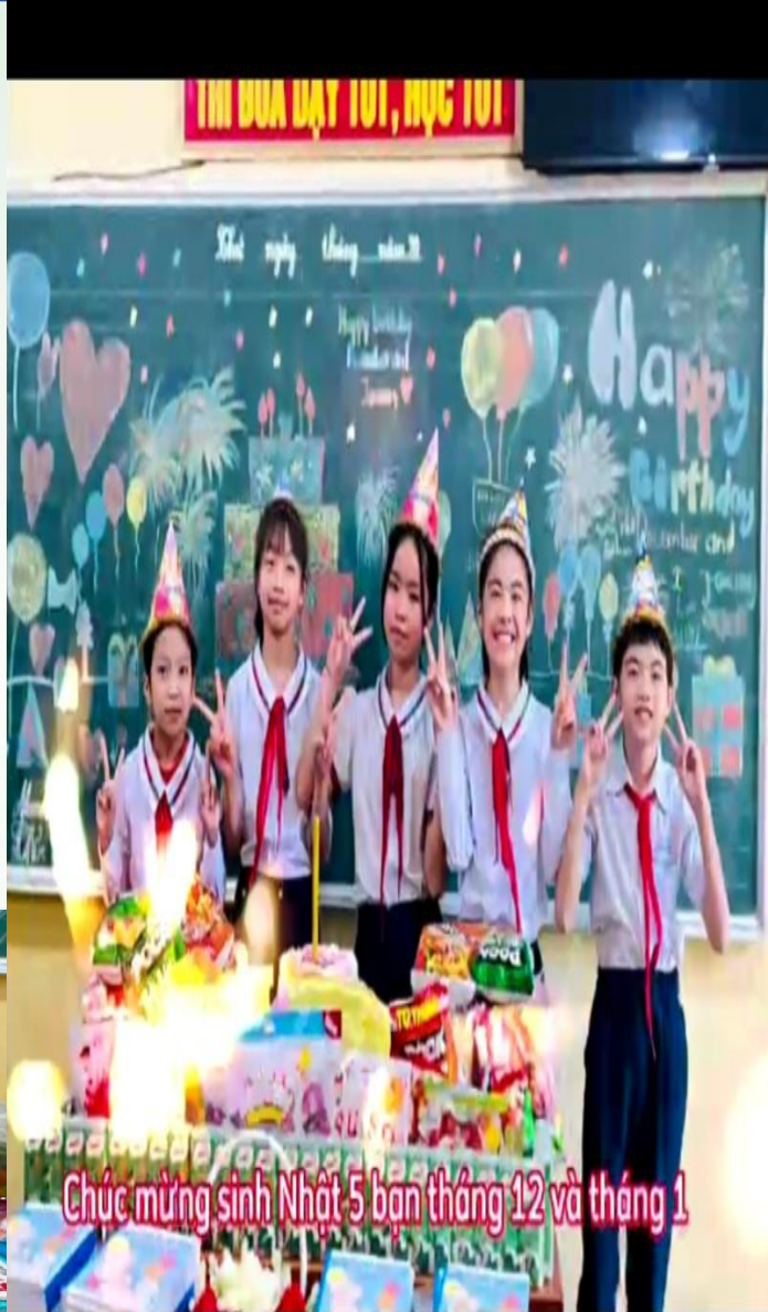
Chúc mừng sinh Nhật 5 bạn tháng 12 và tháng 1