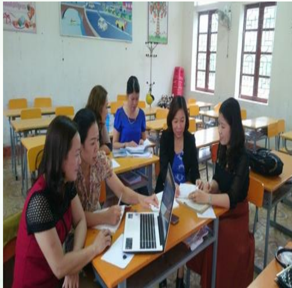
Trao đổi với GVCN năm trước và GVBM