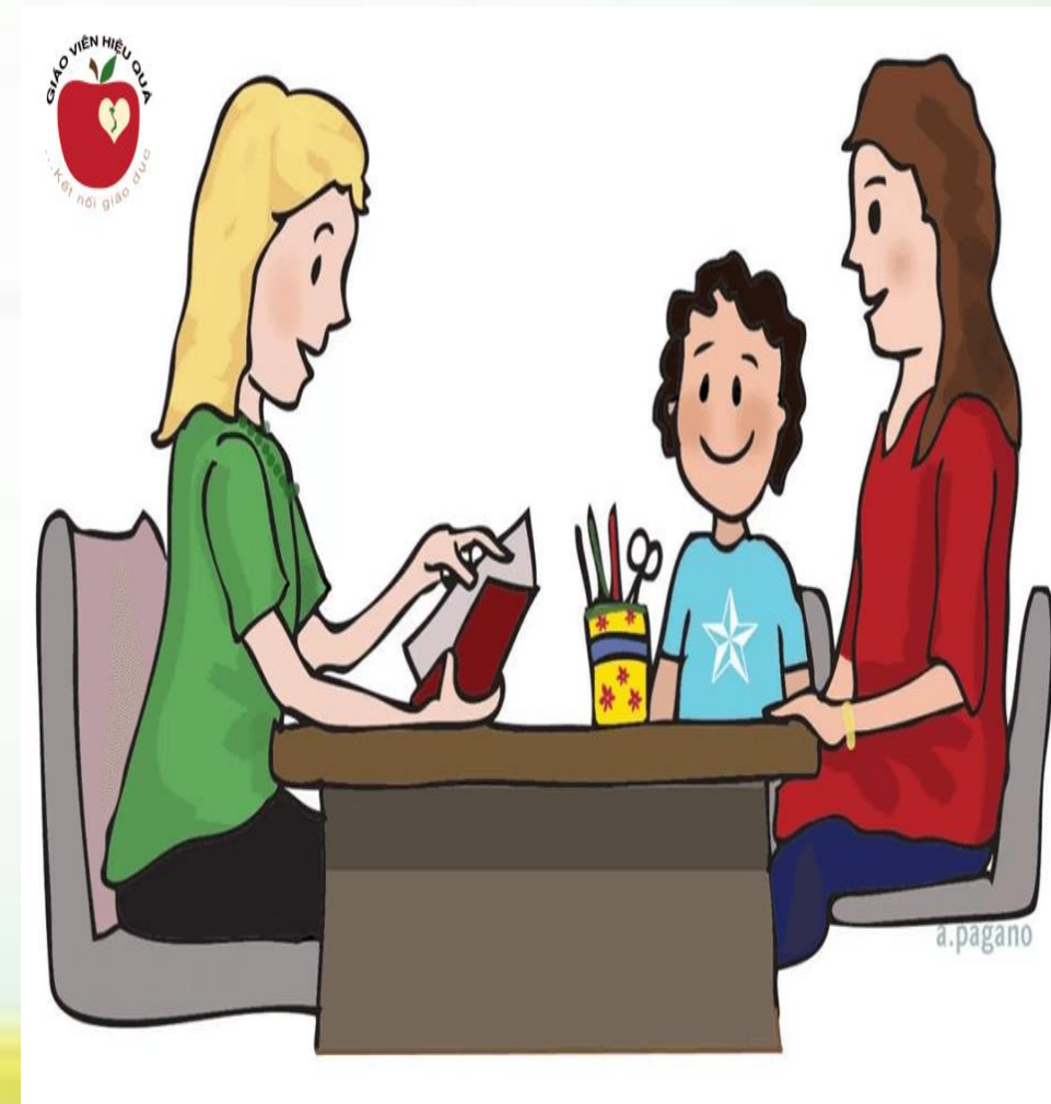
Trao đổi với Phụ huynh và HS