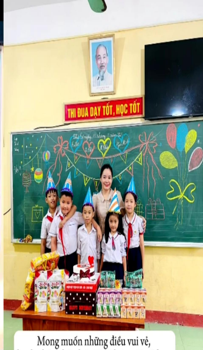
Mong muốn những điều vui vẻ, hạnh phúc nhất thế giới sẽ luôn tới với bạn