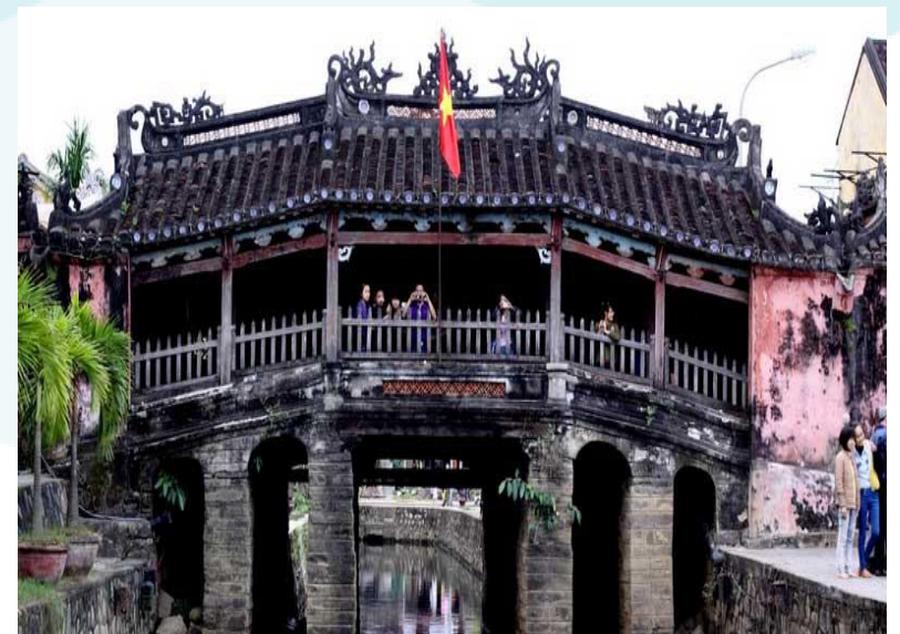
Chùa Cầu - Hội An