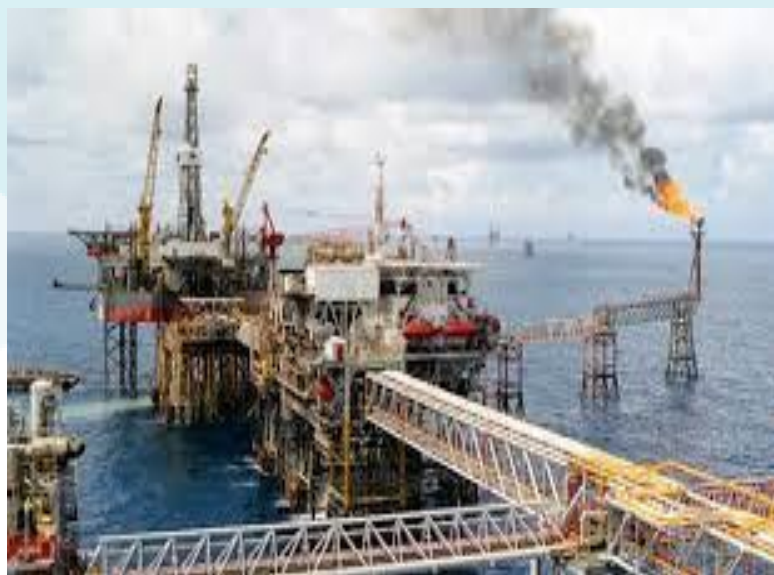
Mỏ dầu Bạch Hổ