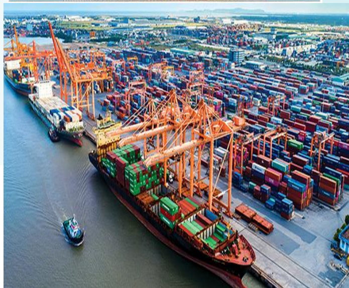
Cảng Hải Phòng