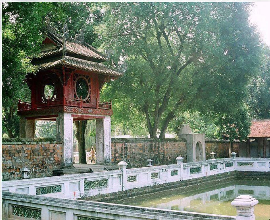
Văn Miếu - Quốc Tử Giám - Hà Nội

Câu 2: Đọc mệnh giá, nêu hình ảnh và màu sắc có trong các đồng tiền bên?