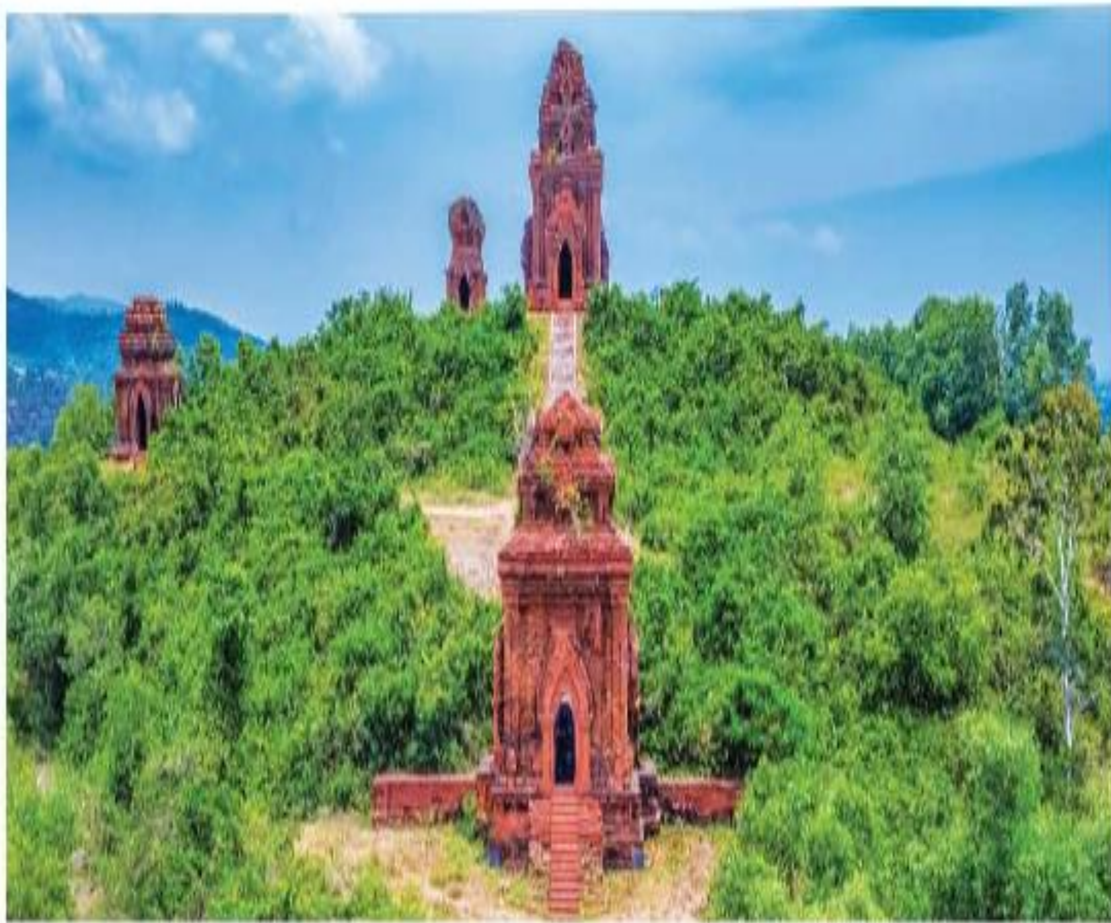
▲ Hình 4. Tháp Bánh Ít (Bình Định)