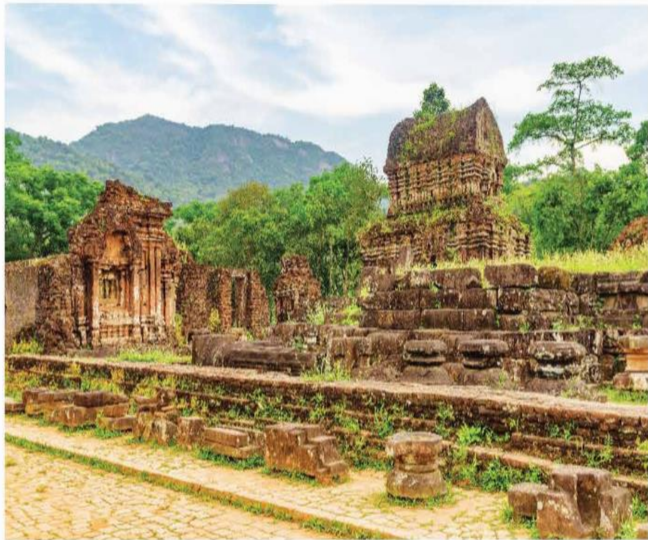
▲ Hình 3. Khu di tích Thánh địa Mỹ Sơn (Quảng Nam)