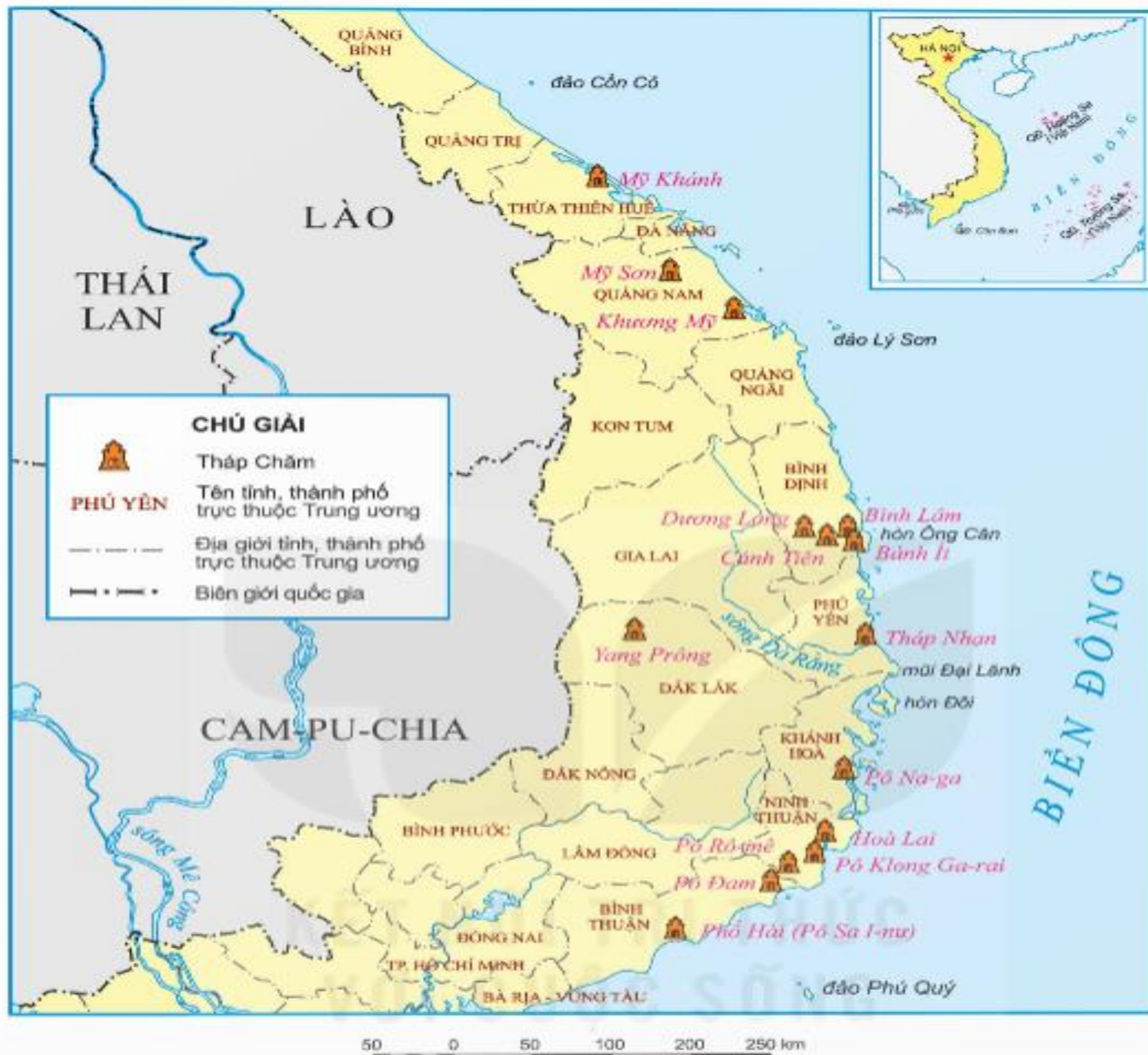
▲ Hình 2. Lược đồ phân bố một số đền tháp Chăm ở Việt Nam hiện nay

Kể tên và xác định vị trí của một số đền tháp Chăm trên lược đồ.