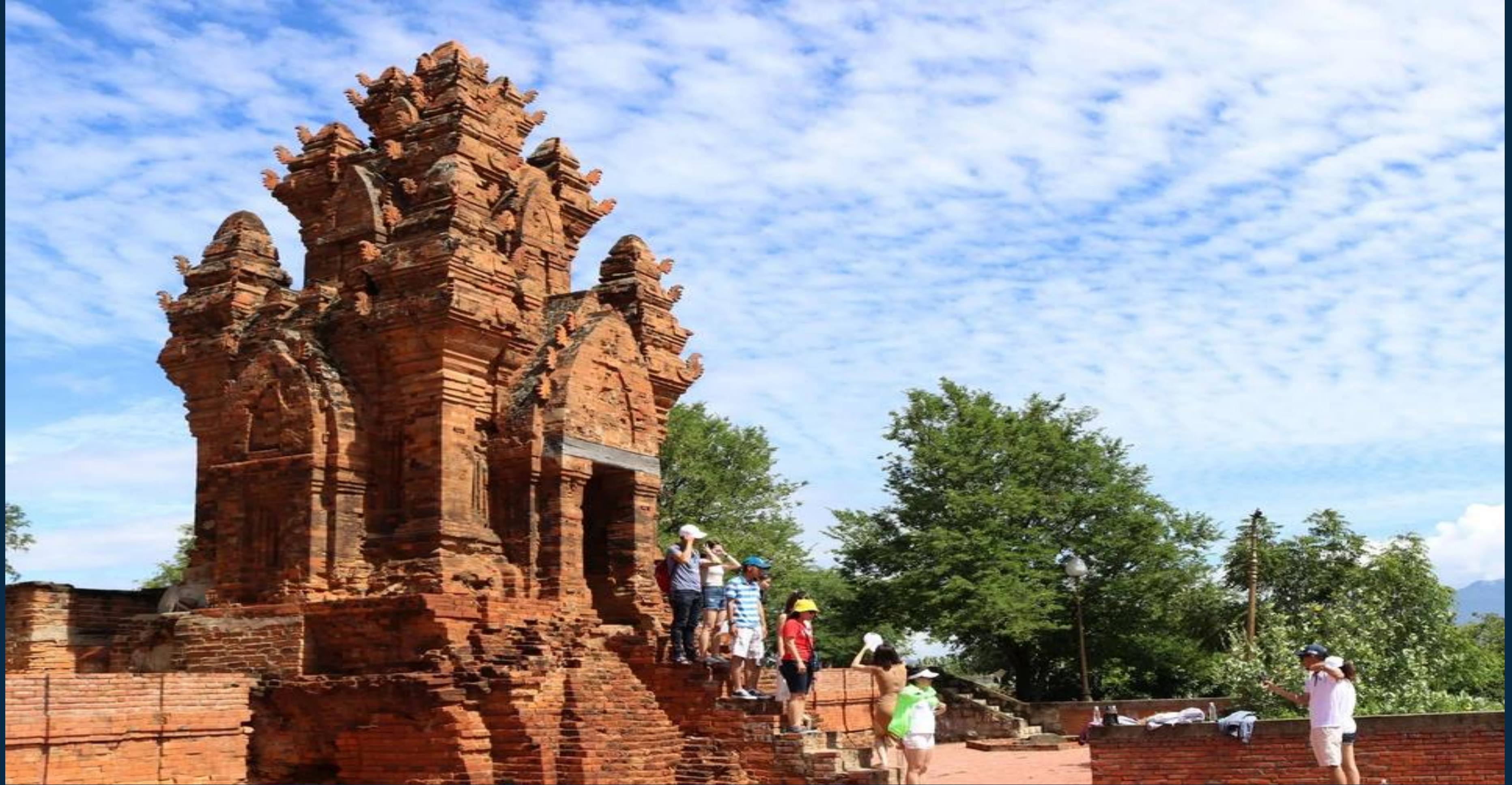
THÁP PHÚ DIÊN (HUẾ)