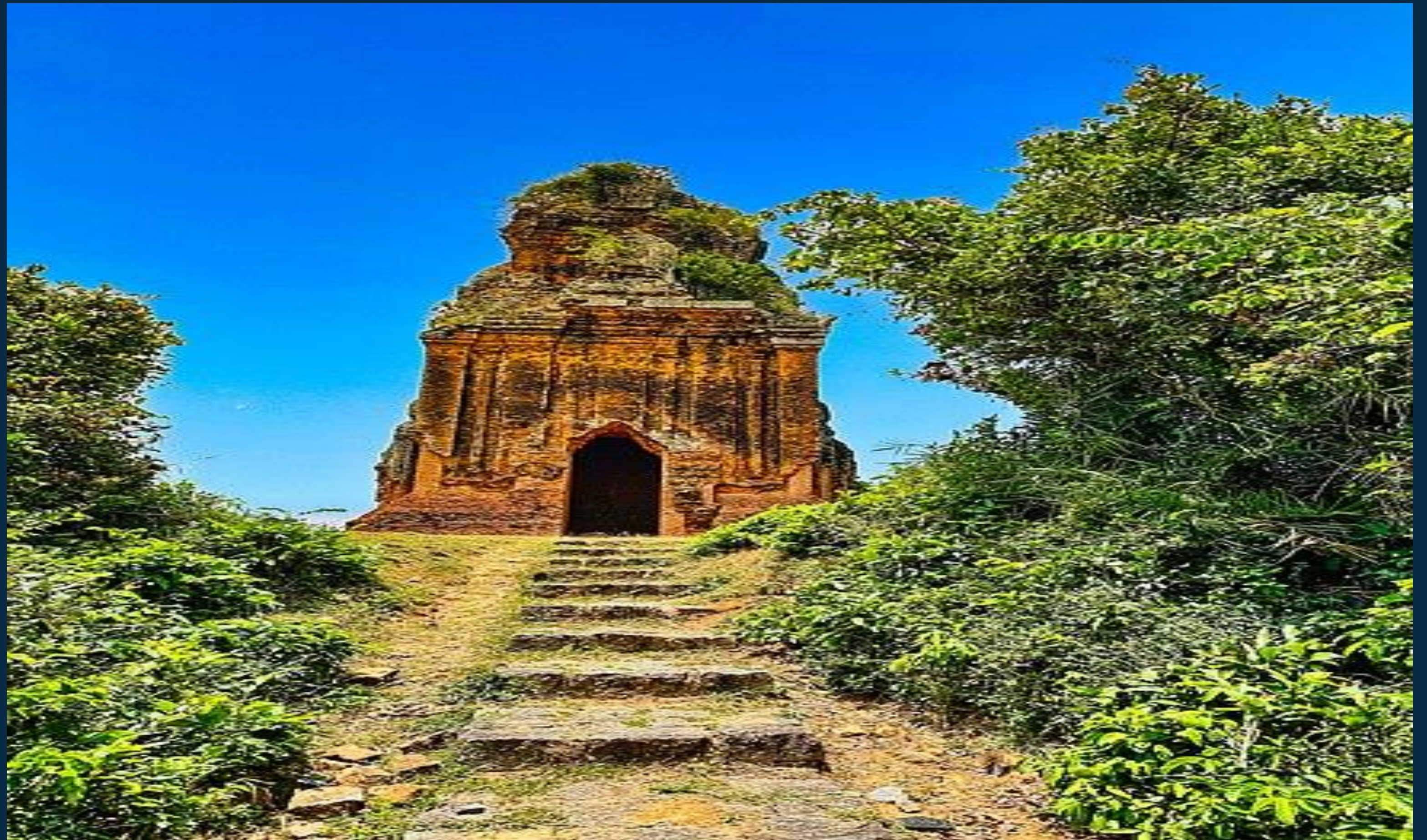
THÁP PHÚ LỐC ( BÌNH ĐỊNH )