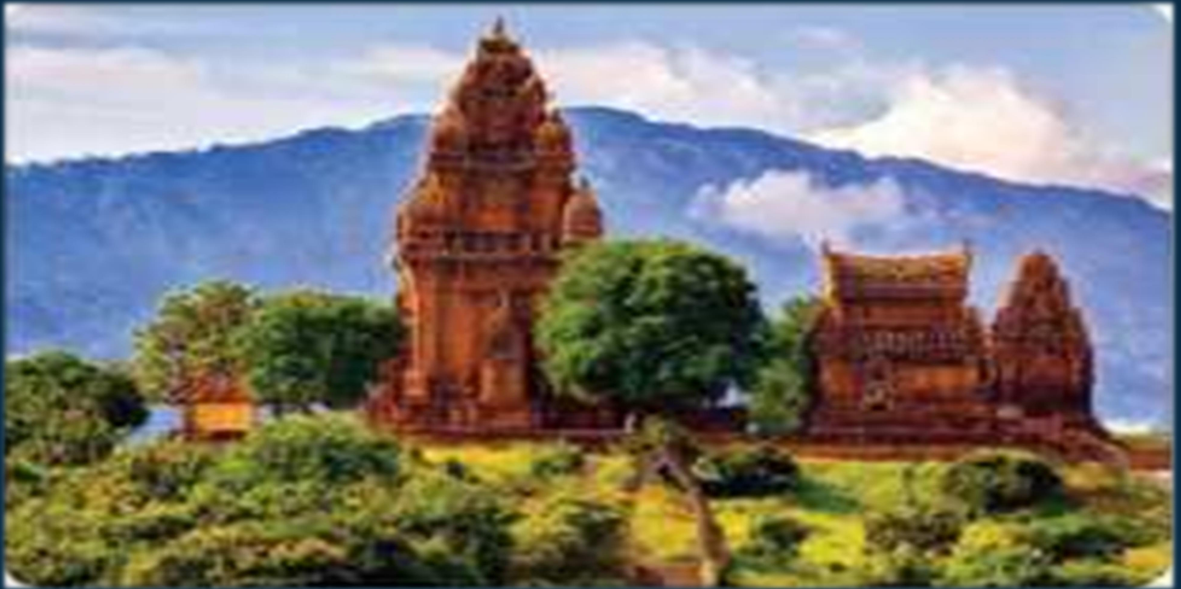
THÁP PÔ KLONG GA-RAI (NINH THUẬN)