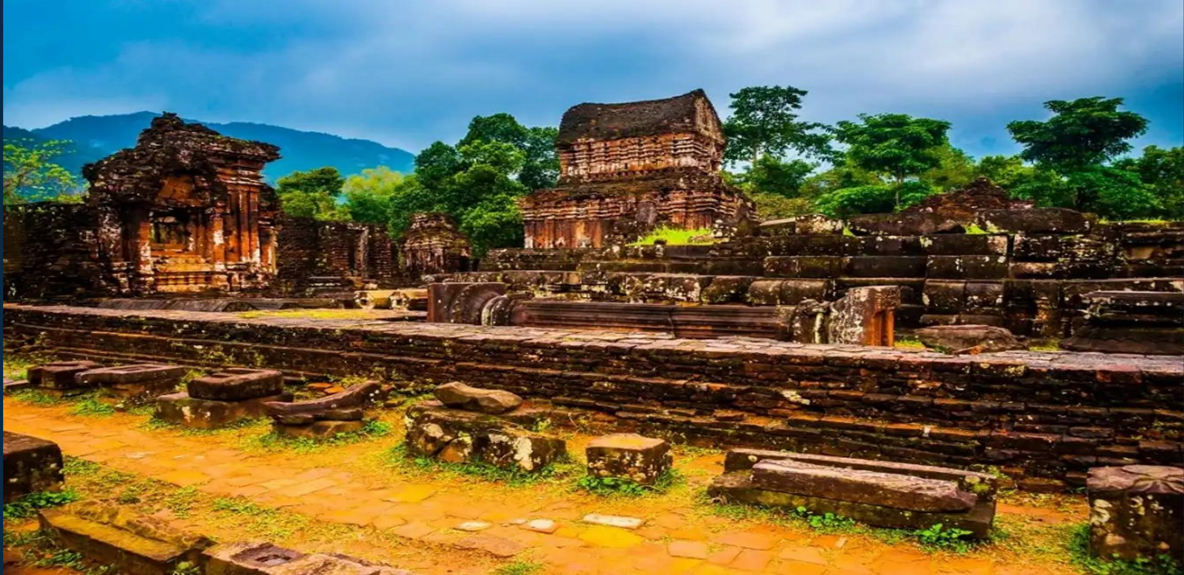
THÁNH ĐỊA MỸ SƠN ( QUẢNG NAM )