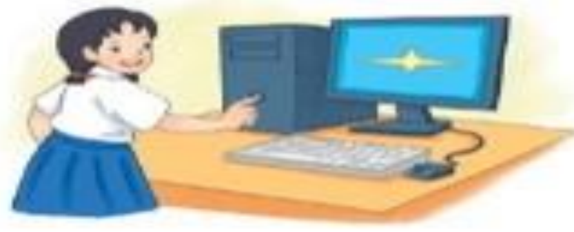
b) An tắt máy tính bằng cách nhấn và giữ nút công tác trên thân máy.

Hình 2: Hành động gây mất an toàn cho máy tính