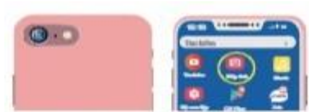
Hình 1: Chụp ảnh bằng điện thoại thông minh

Em hãy quan sát Hình 1 và trả lời các câu hỏi sau: