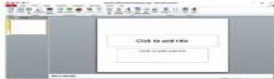
Phần mềm trình chiếu