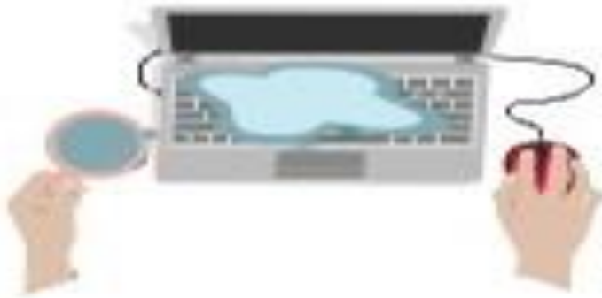
a) Minh vừa dùng máy tính vừa uống nước

1. Chuyện gì xảy ra với máy tính của Minh và máy tính của An?