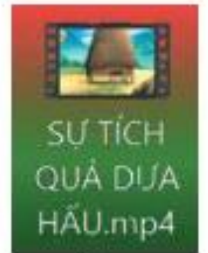
Hình 53. Biểu tượng video Sự tích quả dưa hấu