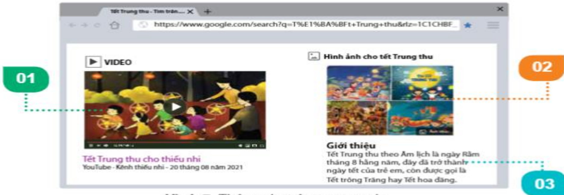
Hình 7. Thông tin trên trang web

Em hãy quan sát trang web ở Hình 7 và cho biết các vị trí được đánh số thể hiện thông tin thuộc dạng nào ?