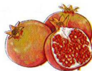
quả l u u