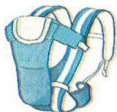
cái đ i u