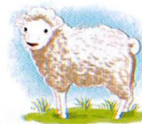
con cừ u