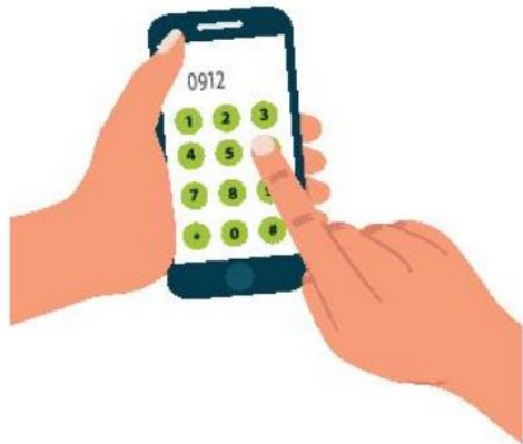
Số điện thoại