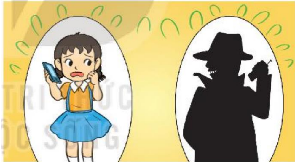
Hình 61. Kẻ xấu lợi dụng thông tin cá nhân để đe dọa, bắt nạt