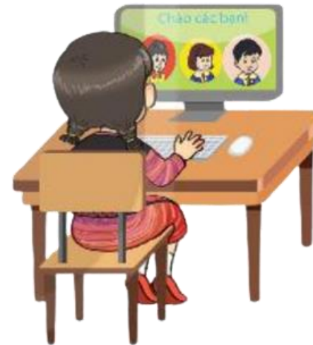
Hình 59. Thông tin có thể lưu trữ trong máy tính