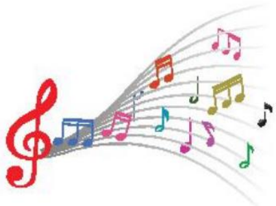
Giọng nói, giọng hát