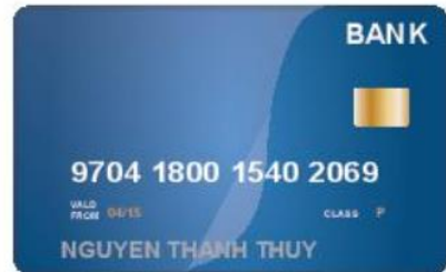
Thông tin ngân hàng