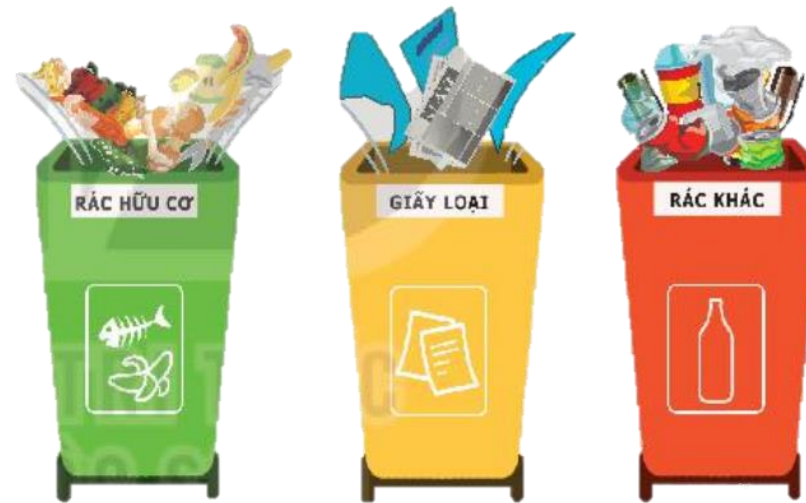
Hình 85. Phân loại rác

Mẫu: Nếu rác là hạt táo thì bỏ vào thùng chứa rác hữu cơ.