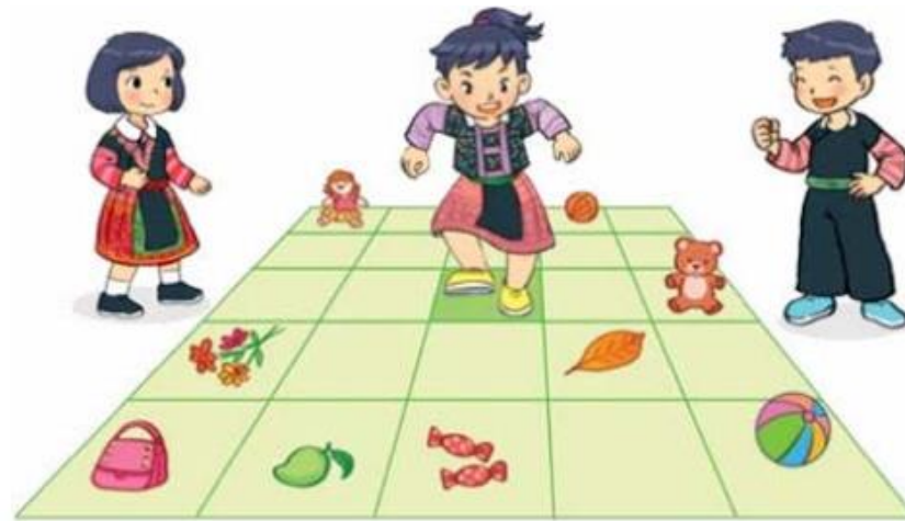
Hình 88. Trò chơi "Em làm rô-bốt"