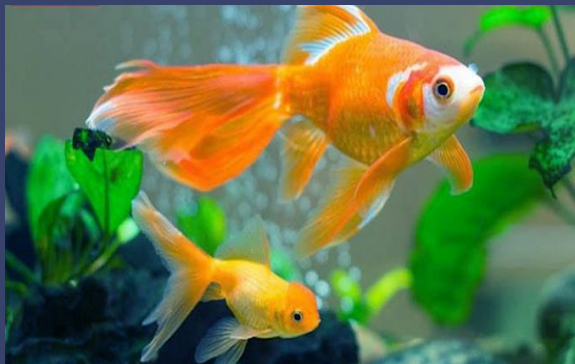
Cá chép vàng