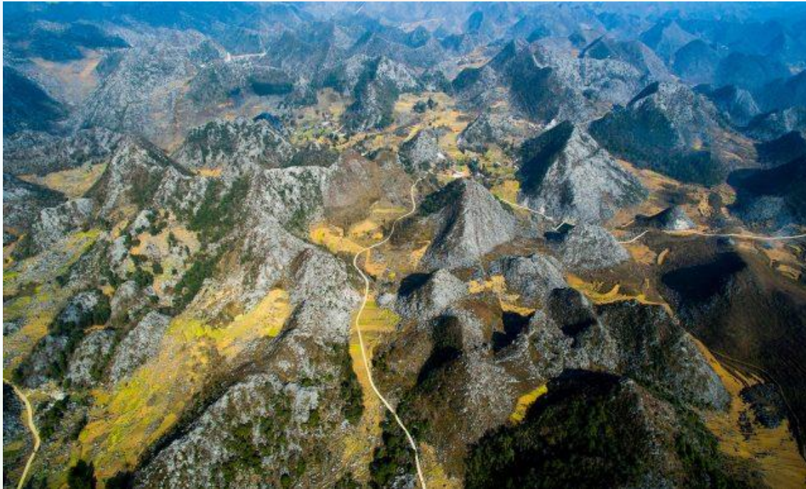
Cao nguyên đá Đồng Văn (Hà Giang)

Hãy kể tên những danh lam thắng cảnh của Việt Nam mà em biết?