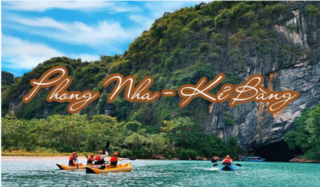
Động Phong Nha – Kẻ Bàng (Quảng Bình)