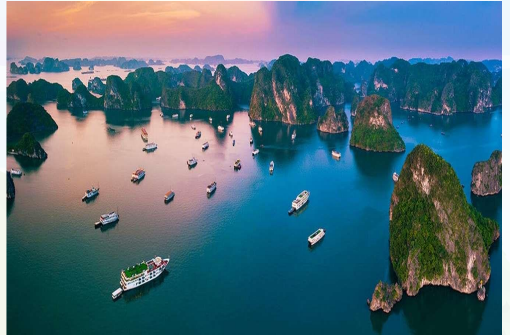
Vịnh Hạ Long (Quảng Ninh)