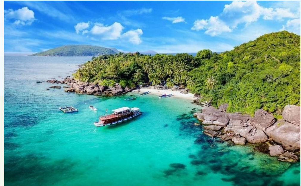
Đảo Ngọc – Phú Quốc (Kiên Giang)