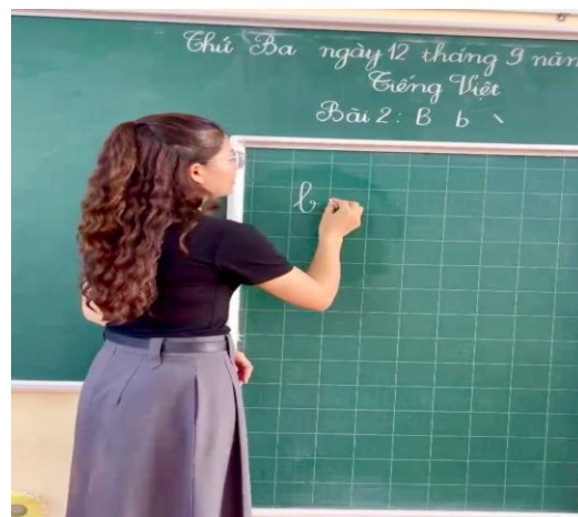
Ảnh: GV viết chữ mẫu

Ngoài chữ mẫu giáo viên viết trực tiếp cho học sinh quan sát, tôi còn sử dụng các công cụ hỗ trợ từ phần mềm powerpoint khác để thiết kế các hiệu ứng chữ viết theo nét với tốc độ vừa phải để học sinh có thể quan sát kỹ, trong quá trình học sinh quan sát chữ viết giáo viên có thể vừa nói quy trình theo hiệu ứng và vừa có thể quan sát học sinh. Trong lúc học sinh viết, giáo viên có thể xuống chỗ học sinh để kịp thời sửa lỗi, với học sinh chưa viết được giáo viên cầm tay để hướng dẫn học sinh viết. Học sinh vừa quan sát được vừa được thực hành dưới sự hỗ trợ của giáo viên sẽ giúp học sinh khắc sâu hơn.