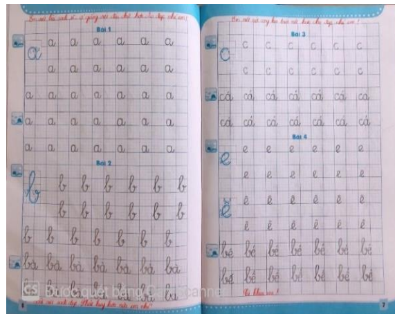
Ảnh: GV chăm chữa thường xuyên

Ngoài ra tôi còn giới thiệu các bài viết chữ đẹp cho học sinh tham khảo. Kể cho học sinh nghe gương rèn chữ viết của các bậc danh nhân như Cao Bá Quát, Nguyễn Văn Siêu, các câu chuyện “Thần Siêu luyện chữ”, “Bàn chân kì diệu”... cho các em nghe và học tập. Từ đó giáo dục các em sự tin tưởng, lòng say mê, yêu thích viết chữ đẹp.