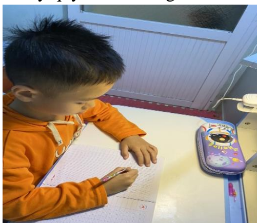
Ảnh: GV kết hợp với PH sát sao kèm cặp con ở nhà

Giáo viên gửi những video chữ viết mẫu đúng chuẩn, đẹp lên nhóm zalo lớp để phụ huynh có thể xem và lấy quy trình hướng dẫn con em mình tự rèn luyện.