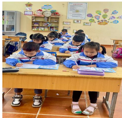
Ảnh: Học sinh ngồi viết đúng tư thế