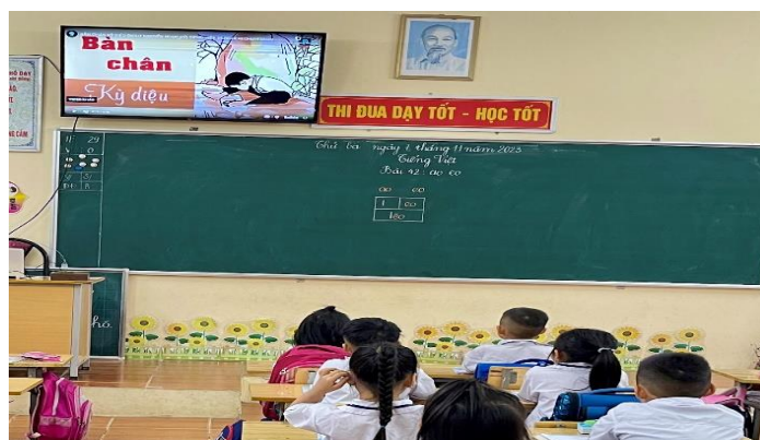
Ảnh: Giáo dục HS tâm gương vượt khó