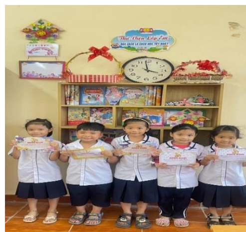
Ảnh: Thư khen HS có tiến bộ