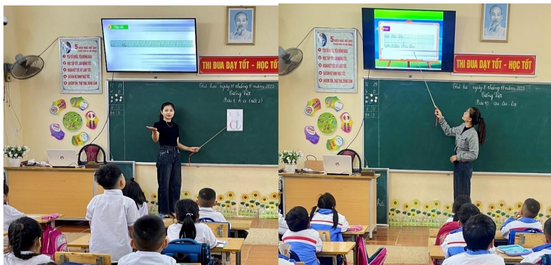
Ảnh: GV sử dụng đồ dùng trực quan

Ngoài chữ mẫu giáo viên viết trực tiếp cho học sinh quan sát, tôi còn sử dụng các công cụ hỗ trợ từ phần mềm powerpoint khác để thiết kế các hiệu ứng chữ viết theo nét với tốc độ vừa phải để học sinh có thể quan sát kỹ, trong quá trình học sinh quan sát chữ viết giáo viên có thể vừa nói quy trình theo hiệu ứng và vừa có thể quan sát học sinh. Trong lúc học sinh viết, giáo viên có thể xuống chỗ học sinh để kịp thời sửa lỗi, với học sinh chưa viết được giáo viên cầm tay để hướng dẫn học sinh viết. Học sinh vừa quan sát được vừa được thực hành dưới sự hỗ trợ của giáo viên sẽ giúp học sinh khắc sâu hơn.