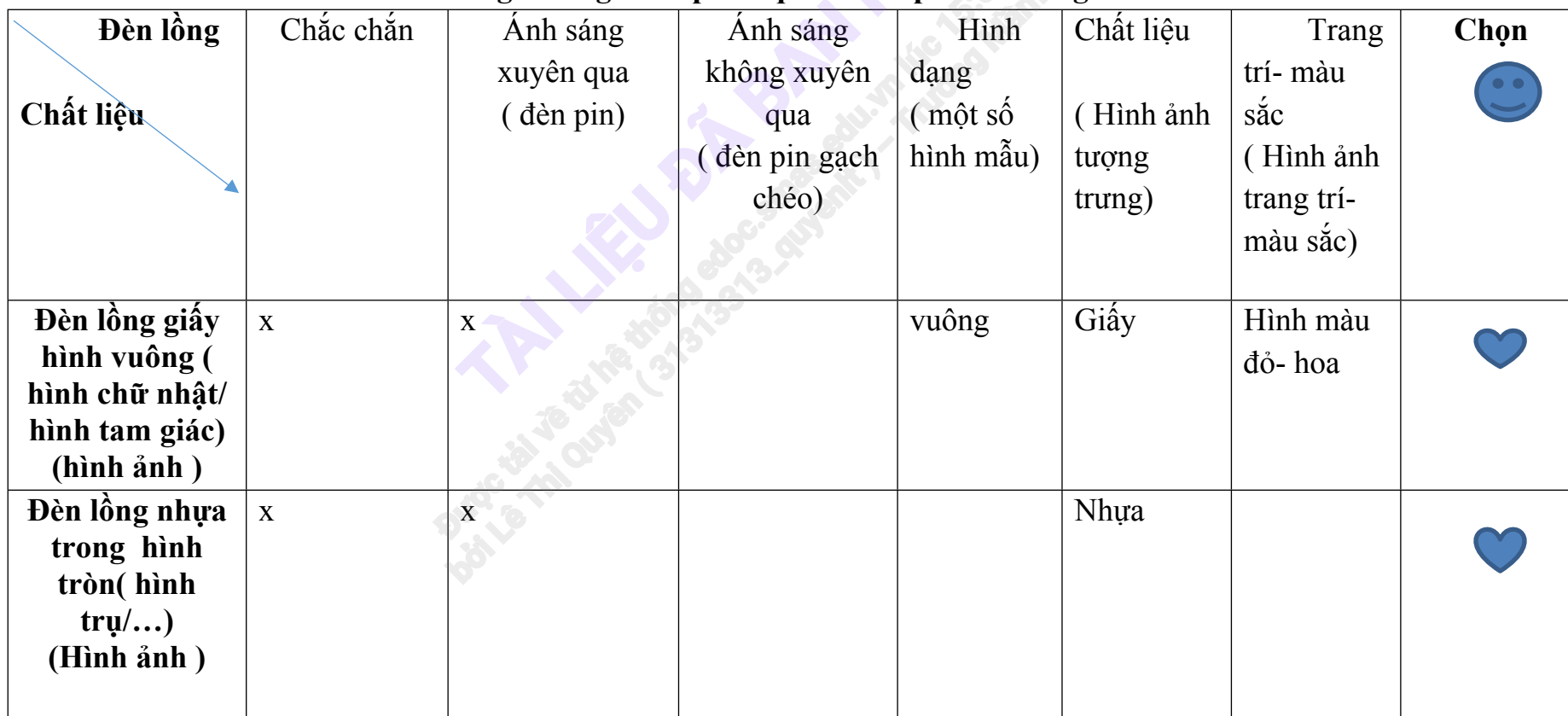
Bảng khảo ghi chép kết quả khám phá đèn lồng

- Cô đưa ra bảng khảo sát và giới thiệu về bảng