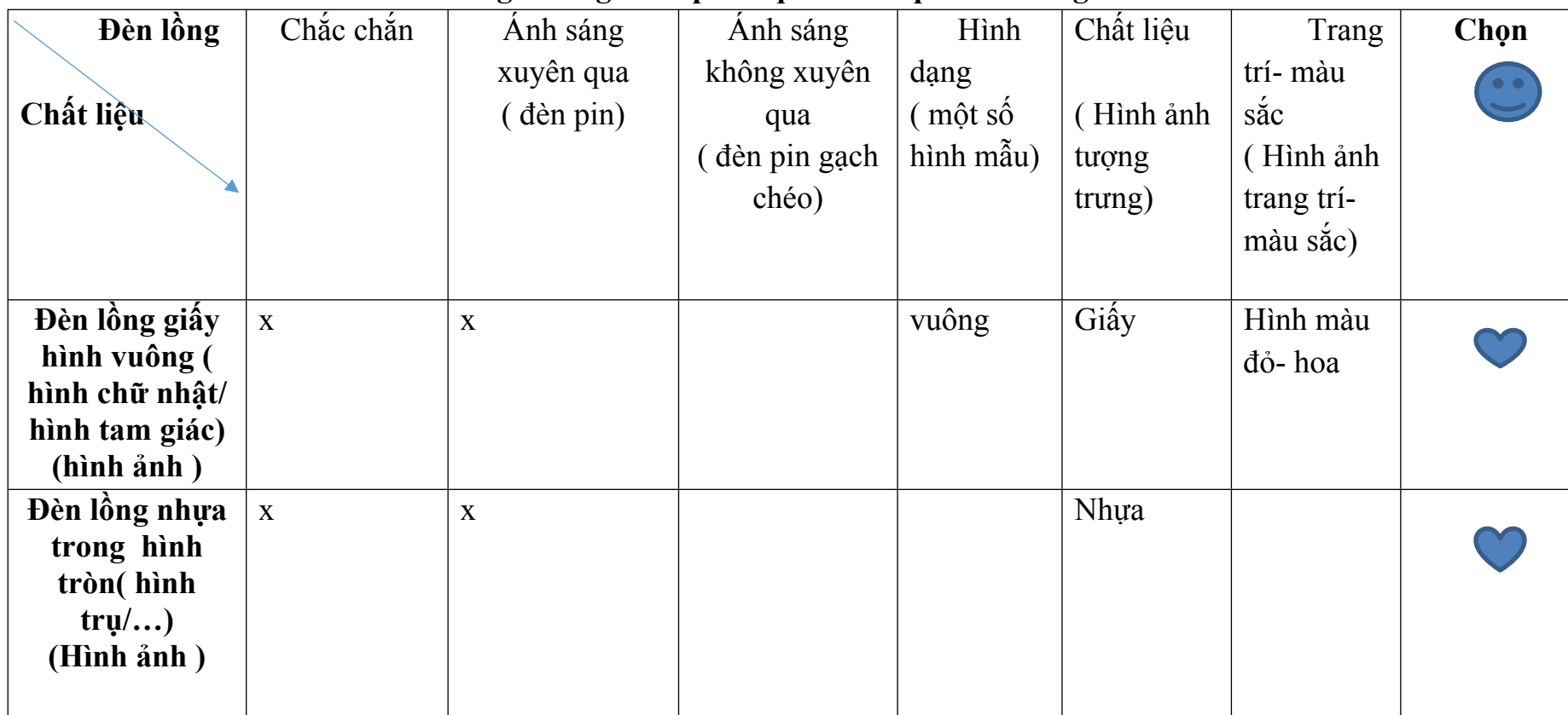
Bảng khảo ghi chép kết quả khám phá đèn lồng

- Cô đưa ra bảng khảo sát và giới thiệu về bảng