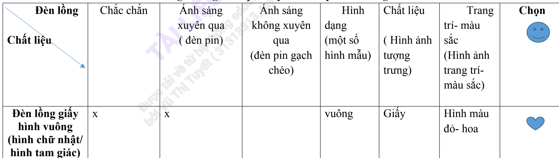
Bảng khảo ghi chép kết quả khám phá đèn lồng