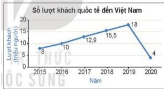
Hình 5.25. (Theo Tổng cục Du lịch)

Em hãy lập bảng thống kê số lượt khách quốc tế đến Việt Nam?