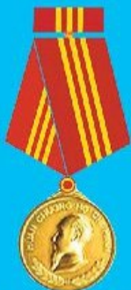
HUÂN CHƯƠNG HỒ CHÍ MINH