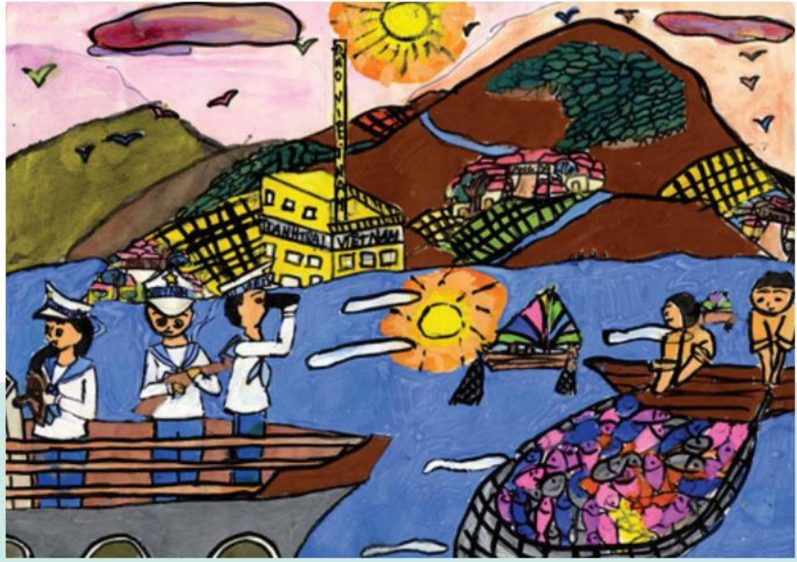
1. Chu Hải Hà, Các chú hải quân bảo vệ ngư dân, sản phẩm mỹ thuật từ màu bột