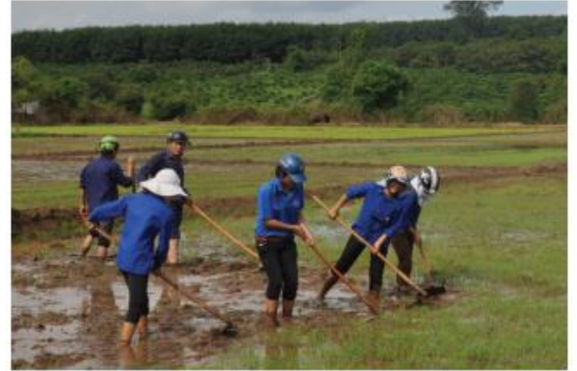
2. Thanh niên tình nguyện giúp người dân làm ruộng (2)