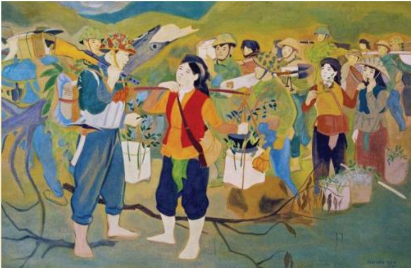
1. Mai Văn Hiến, Gặp nhau , 1954, tranh màu bột (1)