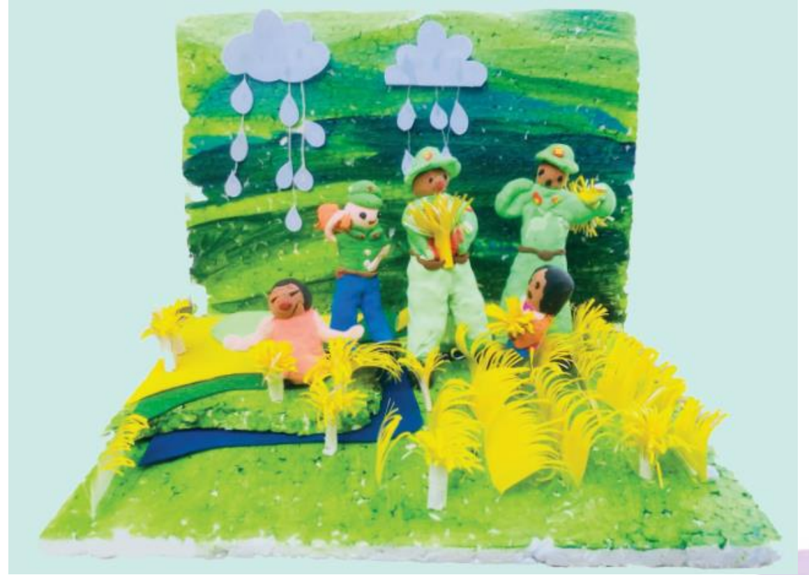
2. Lê Minh Công, Thu hoạch lúa giúp dân , sản phẩm mỹ thuật từ nhiều vật liệu