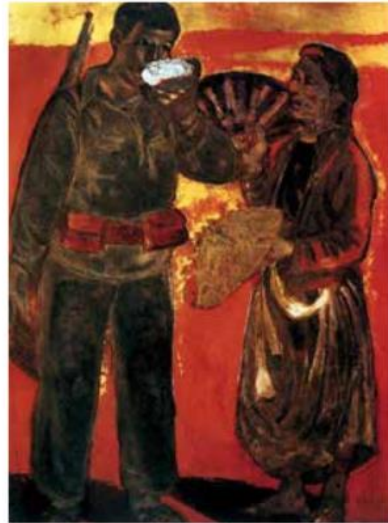
Nguyễn Sỹ Ngọc, Tình quân dân , 1949, tranh sơn mài (1)

Những việc làm bình dị mà cao quý trong cuộc sống là những việc tốt, có ích cho những người xung quanh mình, cho cộng đồng và cho quê hương, đất nước.