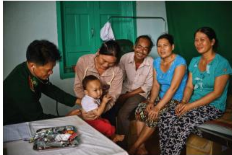
3. Bộ đội biên phòng khám sức khỏe cho người dân (3)