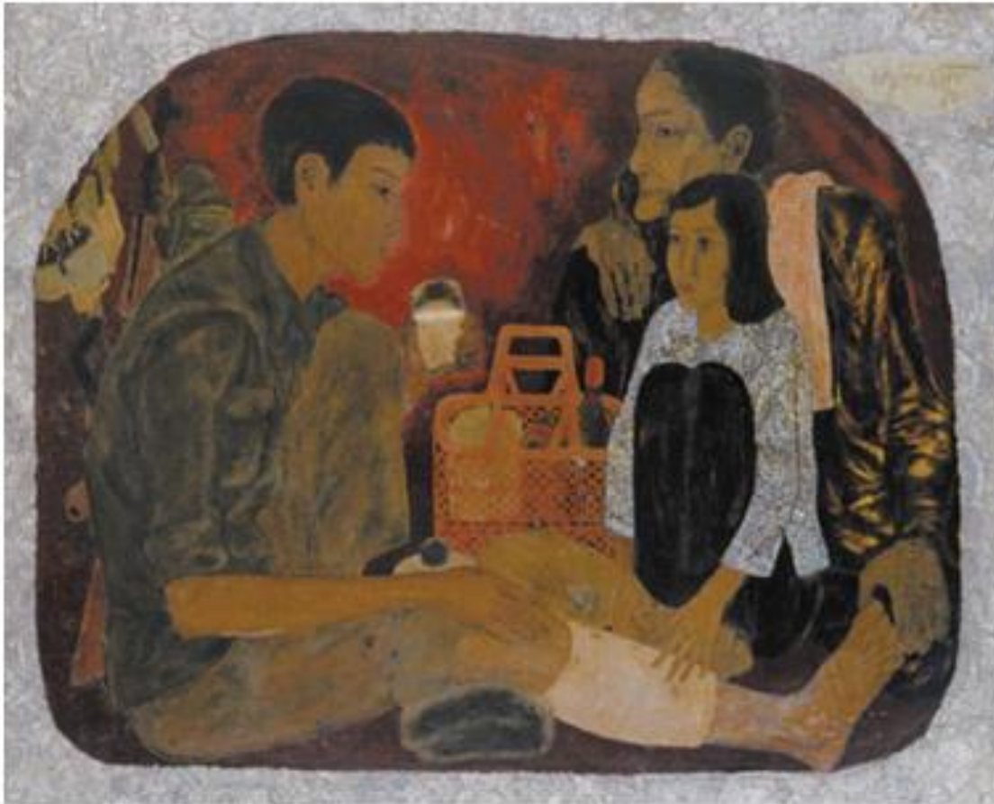
2. Hoàng Trầm, Mẹ kháng chiến , 1980, tranh sơn mài (2)