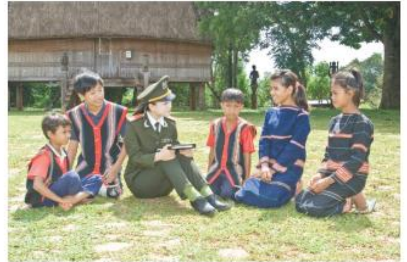
4. Lắng nghe tâm tư, nguyện vọng của người dân (4)