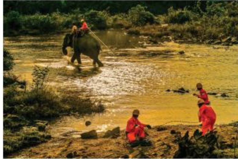
1. Đưa điện về buôn làng (1)