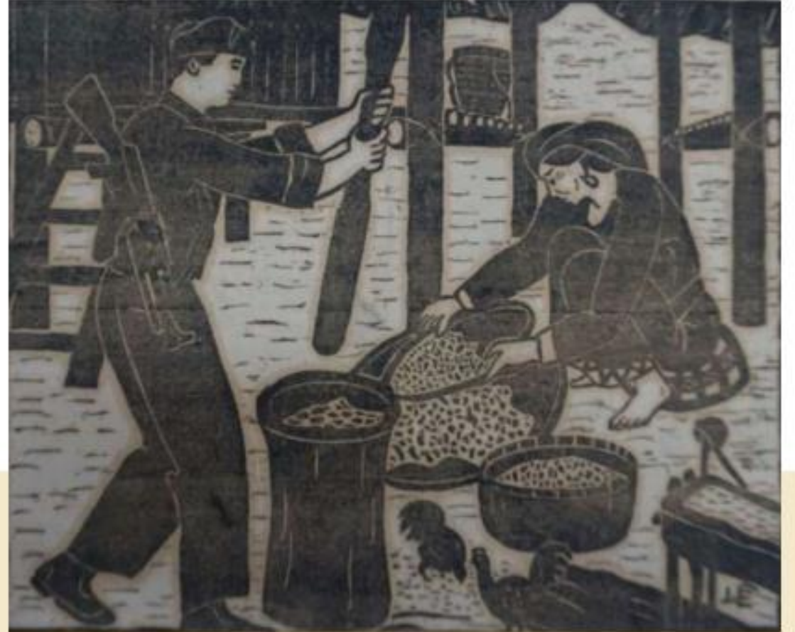
2. Nguyễn Như Lê, Giúp dân , 1979, tranh khắc gỗ (2)