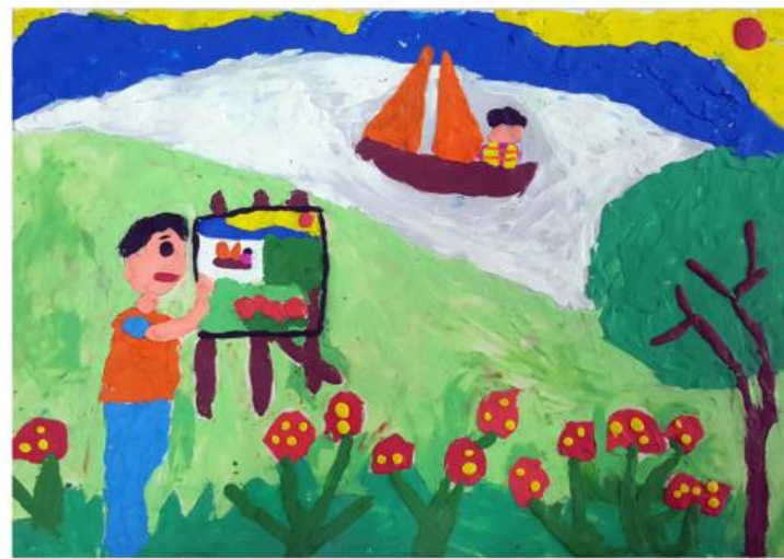
2. Gia Hưng, Kỉ niệm vẽ ngoài trời của em Sản phẩm mỹ thuật từ đất nặn