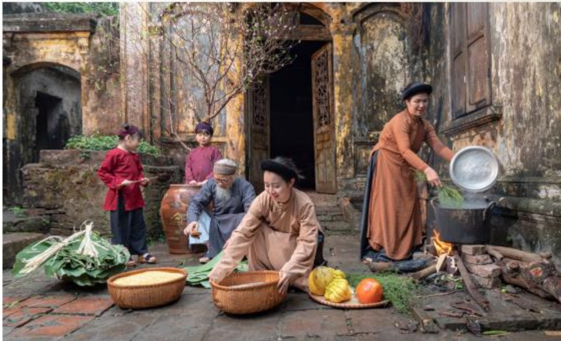
1. Quay quần ngày Tết (1)