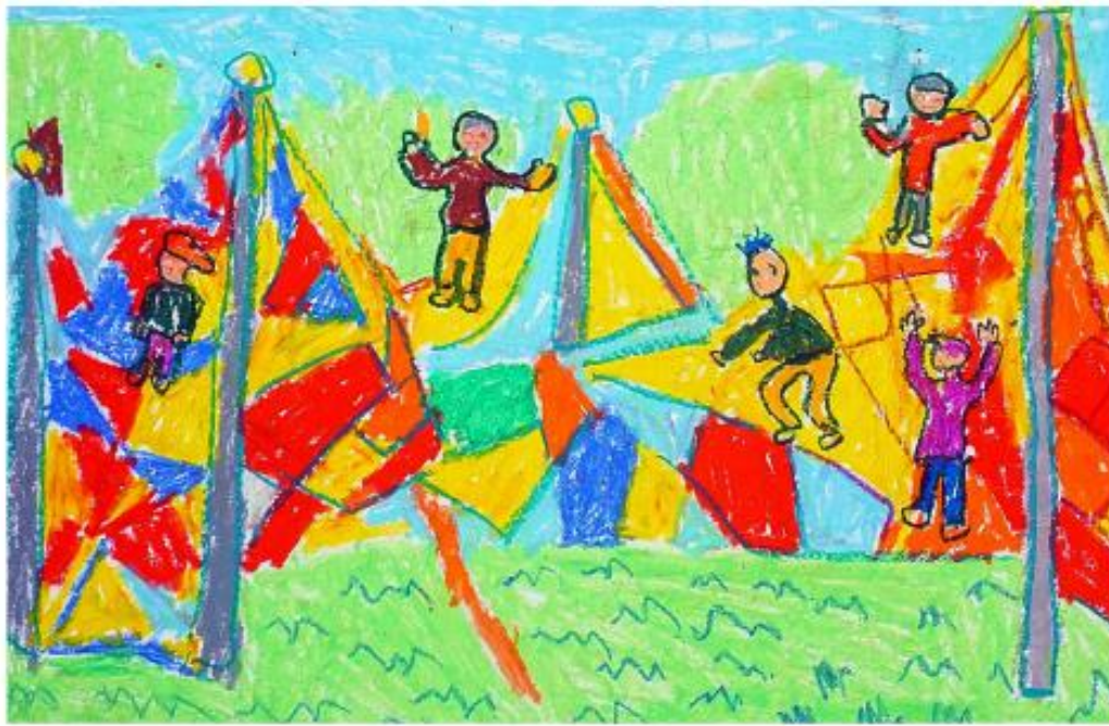
3. Bảo Sơn, Buổi dã ngoại vui vẻ , sản phẩm mỹ thuật từ màu sáp