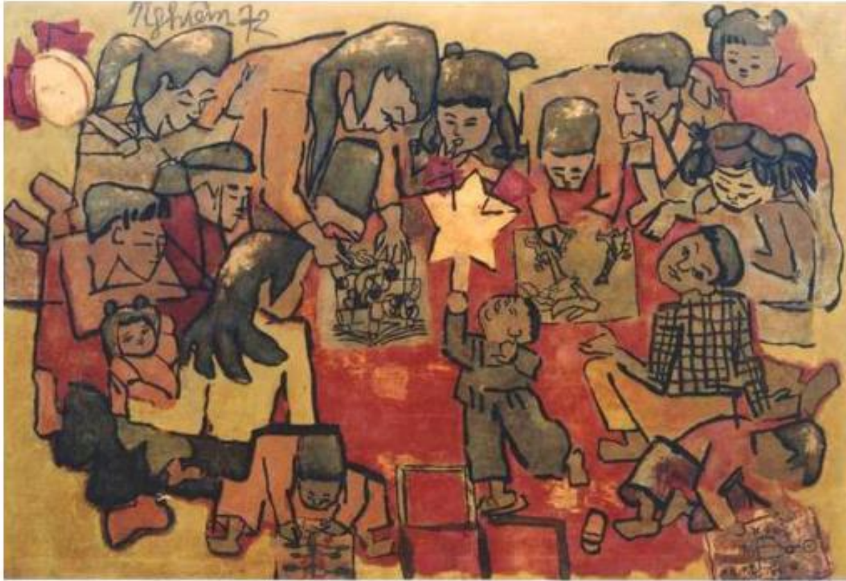
Nguyễn Tư Nghiêm, Trẻ em vui chơi , 1972, tranh sơn mài. (1)