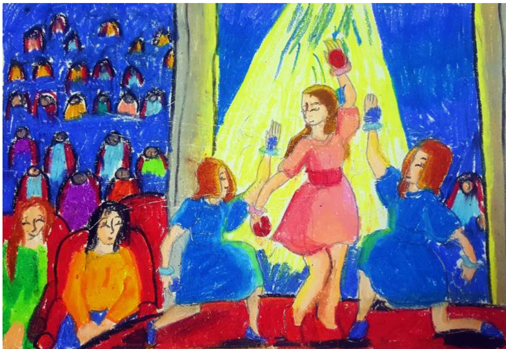
Trương Hồng Ánh, Đi xem biểu diễn Sản phẩm mỹ thuật từ màu sáp