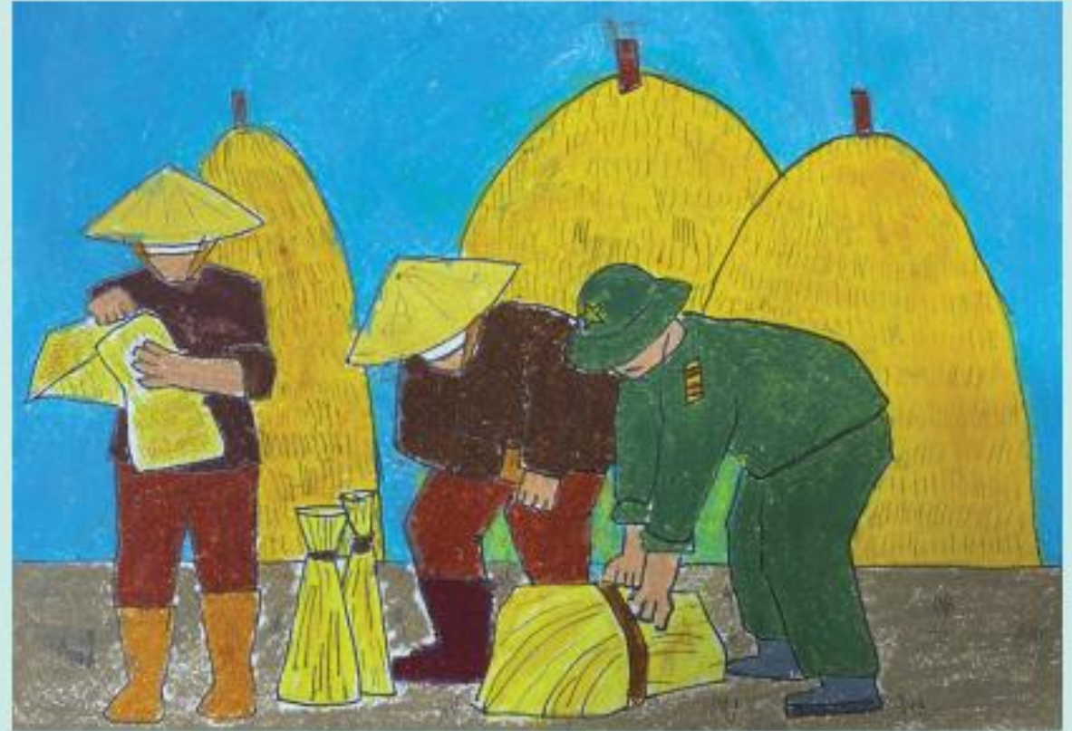
Bước 4. Hoàn thiện sản phẩm

Các sáng tác về đề tài xã hội chính là phản ánh cuộc sống hằng ngày, gần gũi với mọi người. Điều này cần sự quan sát, tìm được những ý tưởng có sự hấp dẫn về nội dung và hình thức thể hiện.