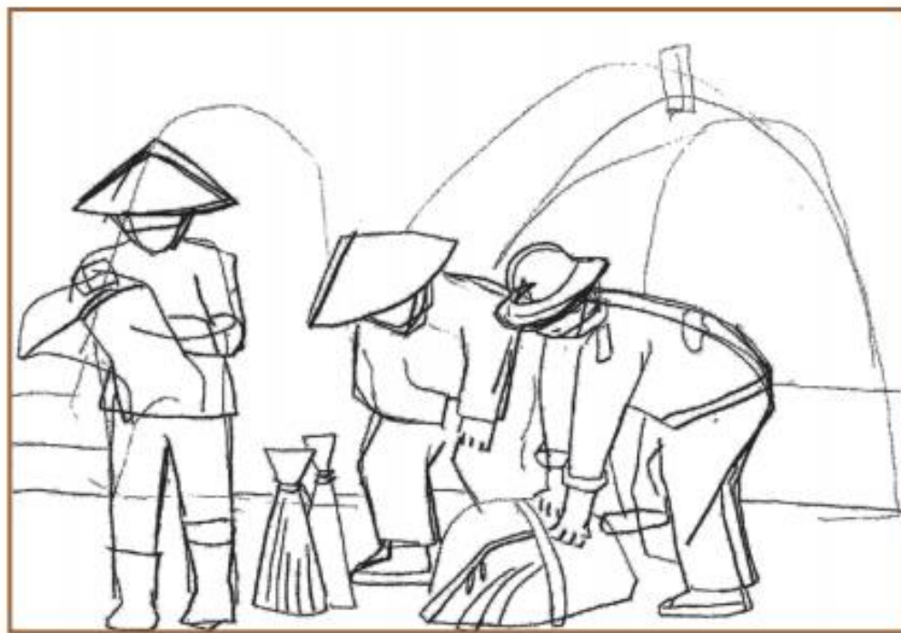
Bước 2. Vẽ hình chi tiết