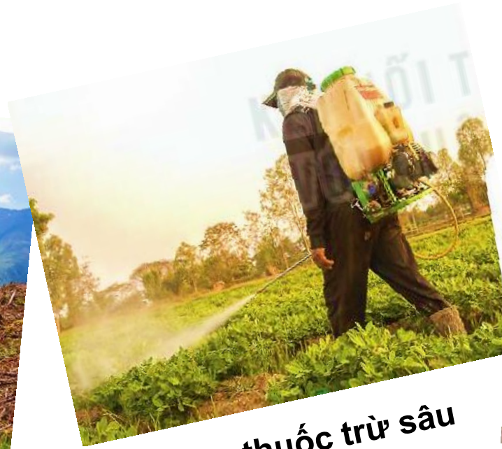
Sử dụng thuốc trừ sâu