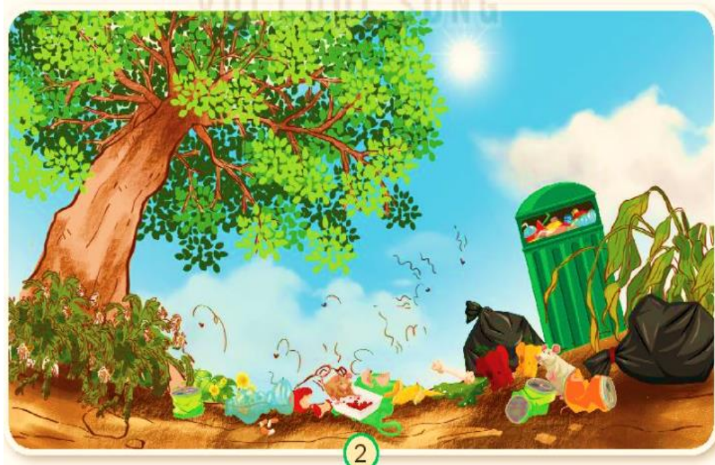
Hình 2: Cây cỏ bắt đầu héo, các con vật không còn, có nhiều rác như chai, lọ.