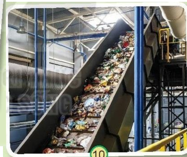
Bảo tồn thiên nhiên