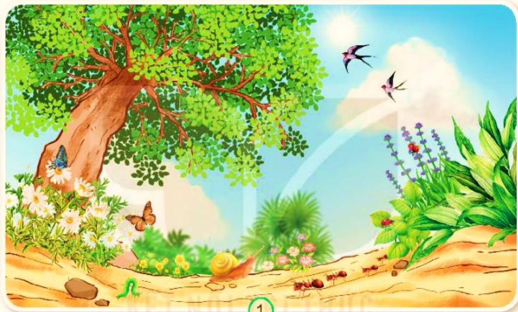
Hình 1: Cây cỏ, hoa lá tươi tốt, nhiều con vật.

+Số lượng thực vật và động vật giảm sút đi, thậm chí có thể biến mất.