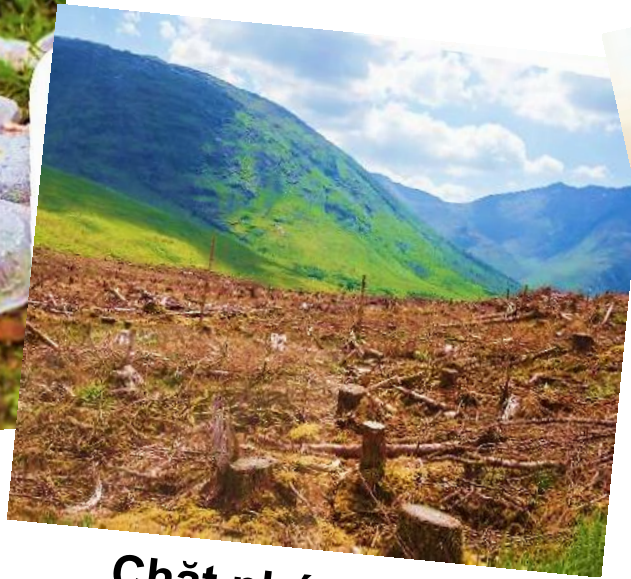
Chặt phá rừng