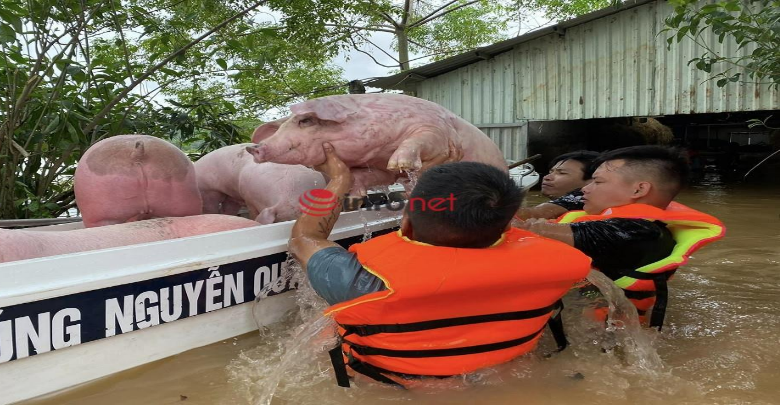
Lực lượng cứu hộ đang hỗ trợ di rời đàn lợn ra khỏi khu vực bị ngập úng