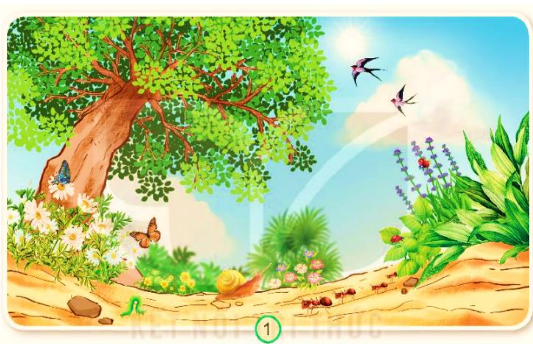
Hình 1: Cây cỏ, hoa lá tươi tốt, nhiều con vật.

=> Do con người xả rác ra môi trường làm cho môi trường bị ô nhiễm, các con vật không còn nơi sống.