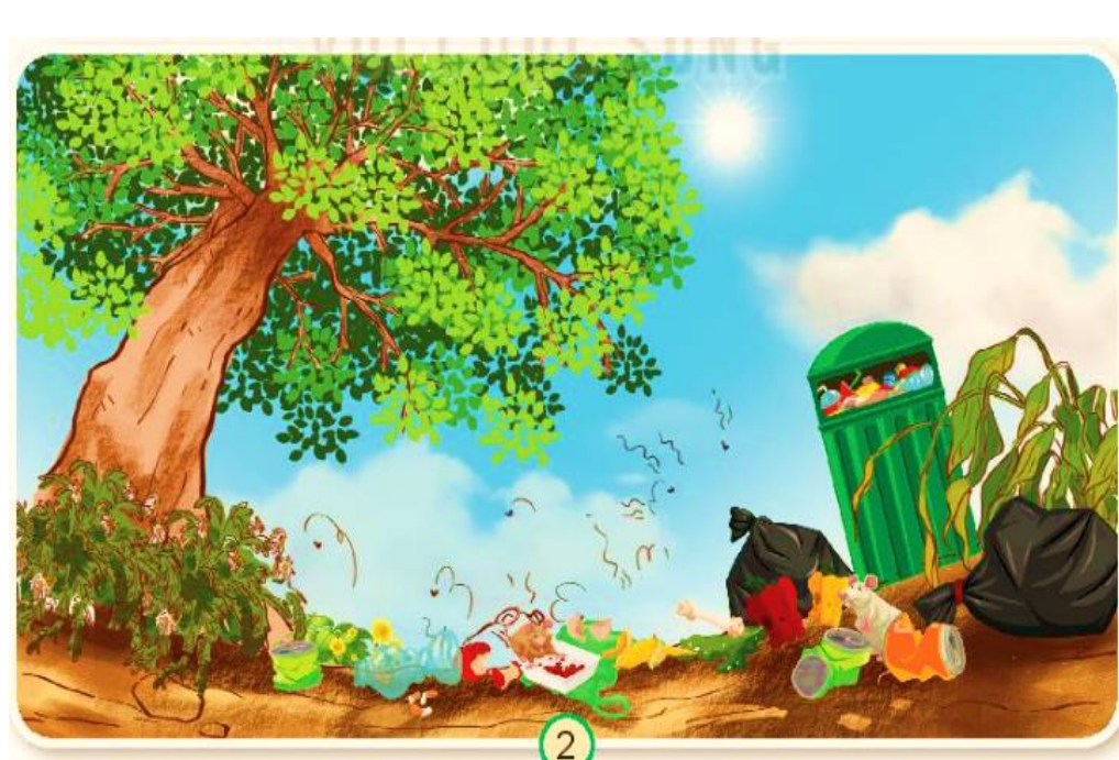
Hình 2: Cây cỏ bắt đầu héo, các con vật không còn, có nhiều rác như chai, lọ.