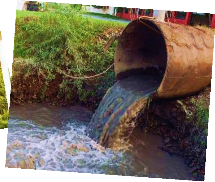
Xả nước thải trực tiếp ra môi trường