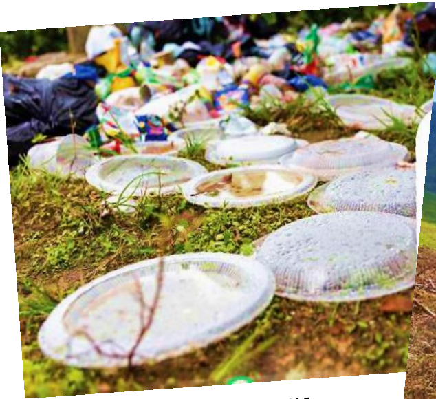
Vứt rác bừa bãi

2. Những việc làm trong từng hình sau có tác hại gì đối với môi trường sống của thực vật và động vật?