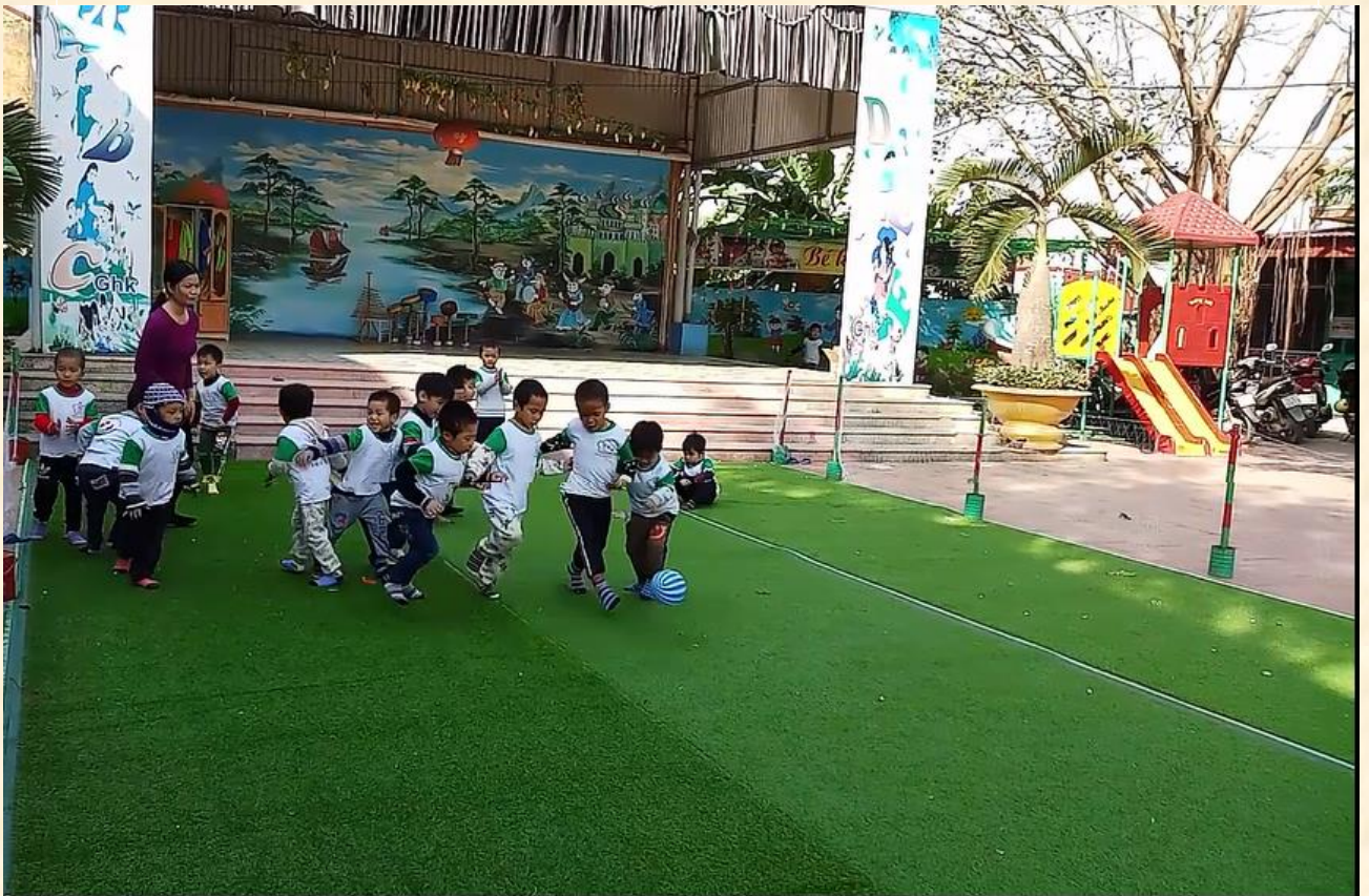
Trò chơi “đá bóng” của các bé 5 tuổi