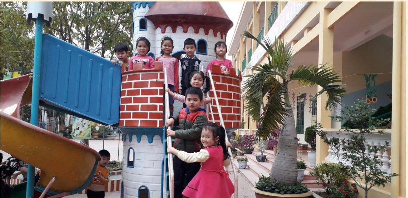
Bé đang chơi các trò chơi trong giờ hoạt động ngoài trời