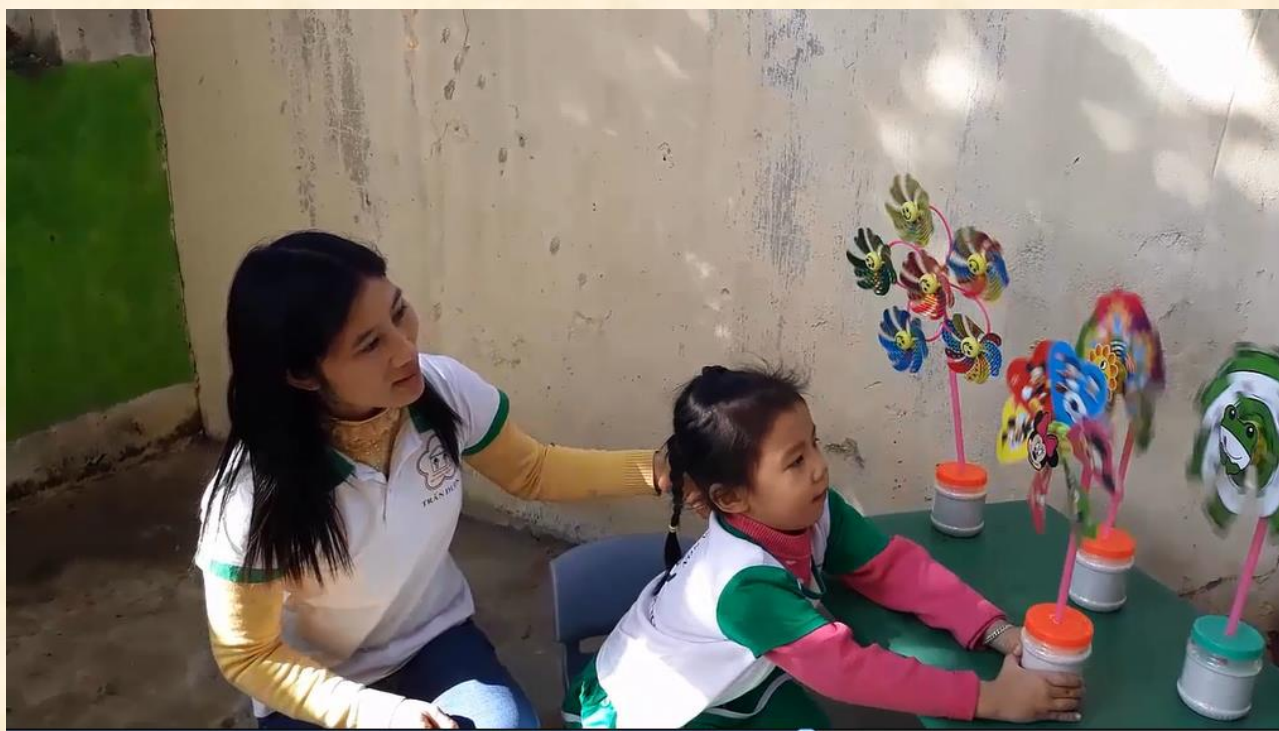
Bé khám phá chiều gió