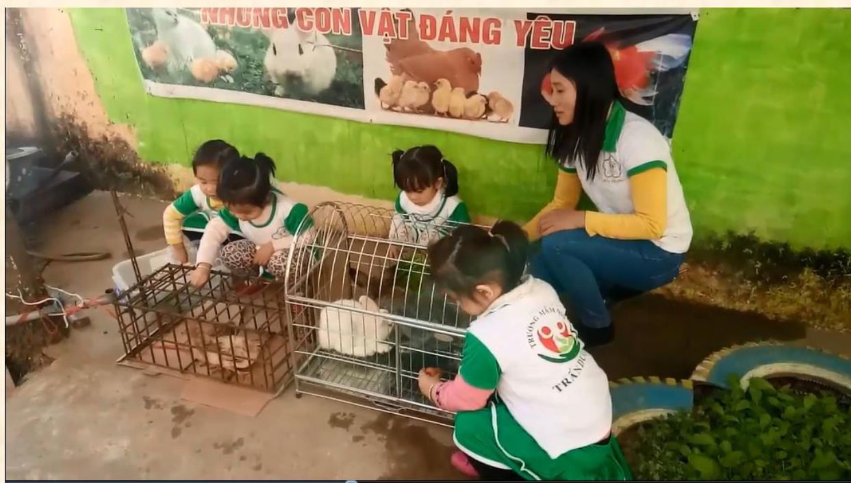
Bé khám phá về các con vật nuôi