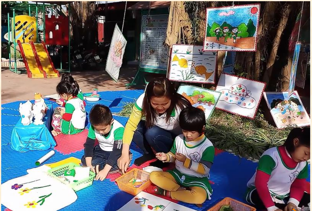
Những tác phẩm nghệ thuật yêu thích của bé