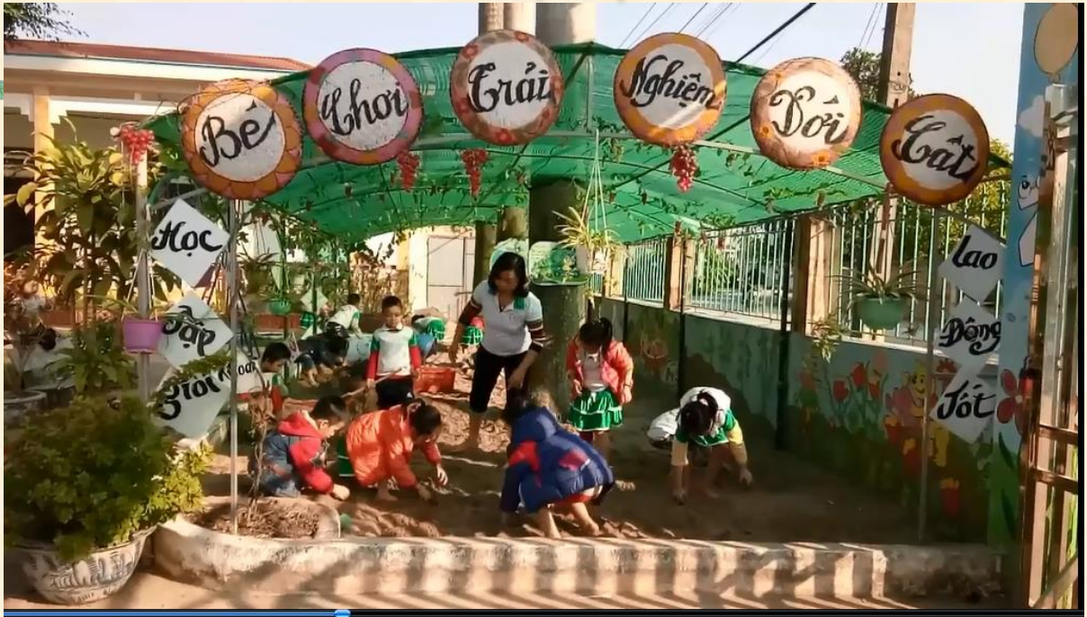
Trò chơi “Tìm củ”