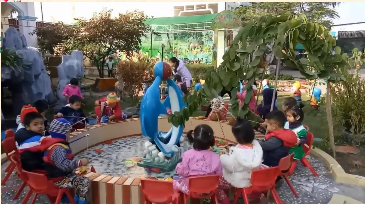
Trò chơi câu cá