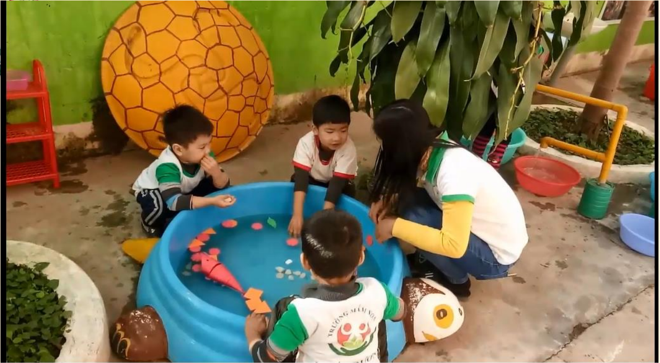
Bé khám phá vật nổi, vật chìm