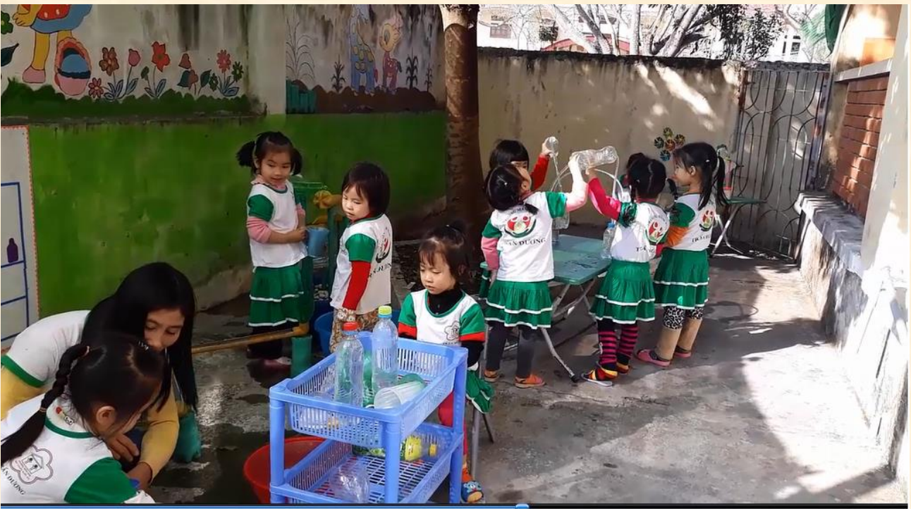
Bé khám phá dòng chảy của nước