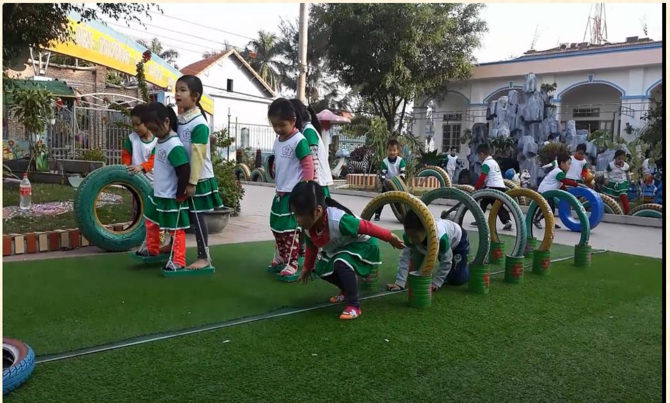
Bé đang chơi các trò chơi vận động