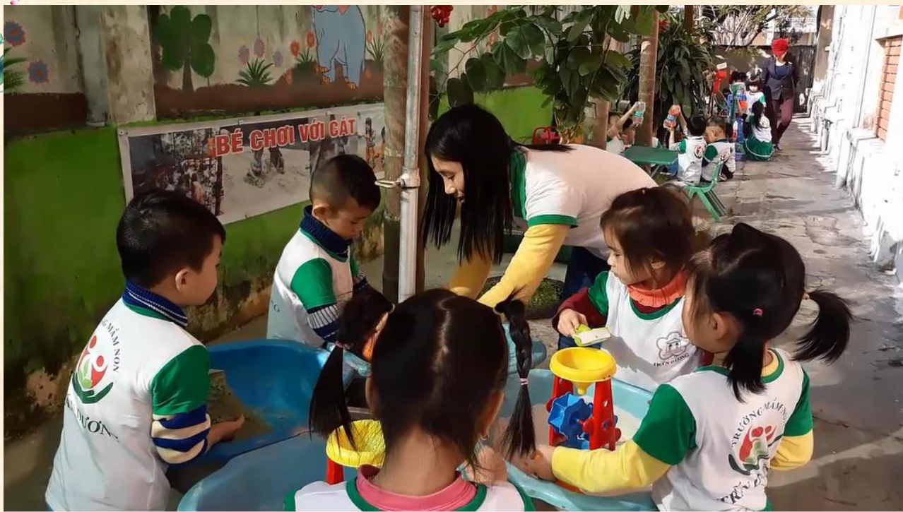
Bé khám phá dòng chảy của cát, in khuôn hình trên cát