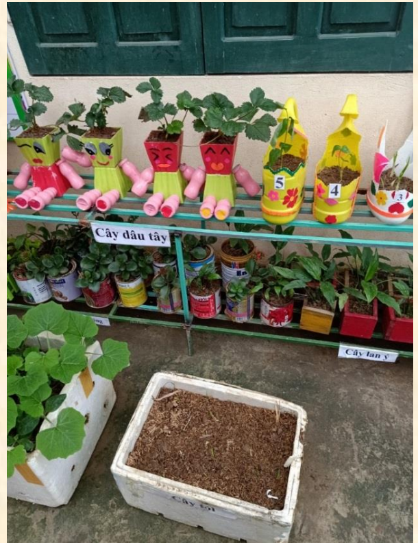
Bé khám phá sự phát triển của cây, thực hành chăm sóc cây