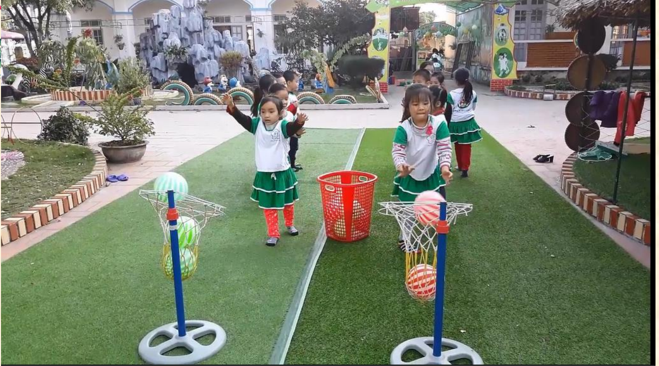
Bé với trò chơi “ Ném bóng vào rổ”