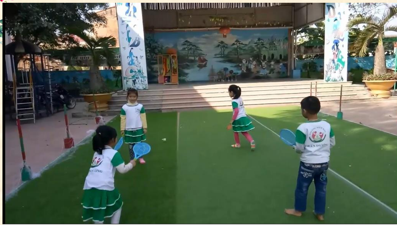
Trò chơi “Đánh cầu lông”