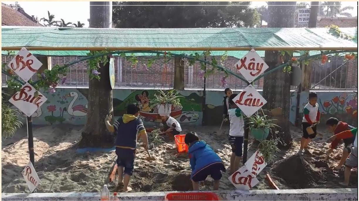
Bé xây lâu đài cát