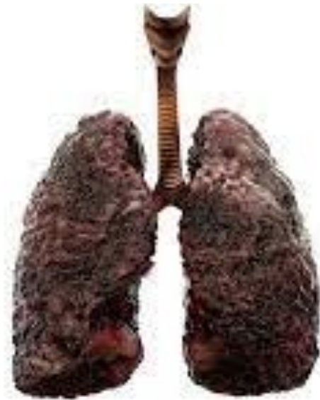
Phổi của người hút thuốc