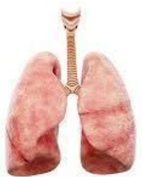
Phổi của người bình thường