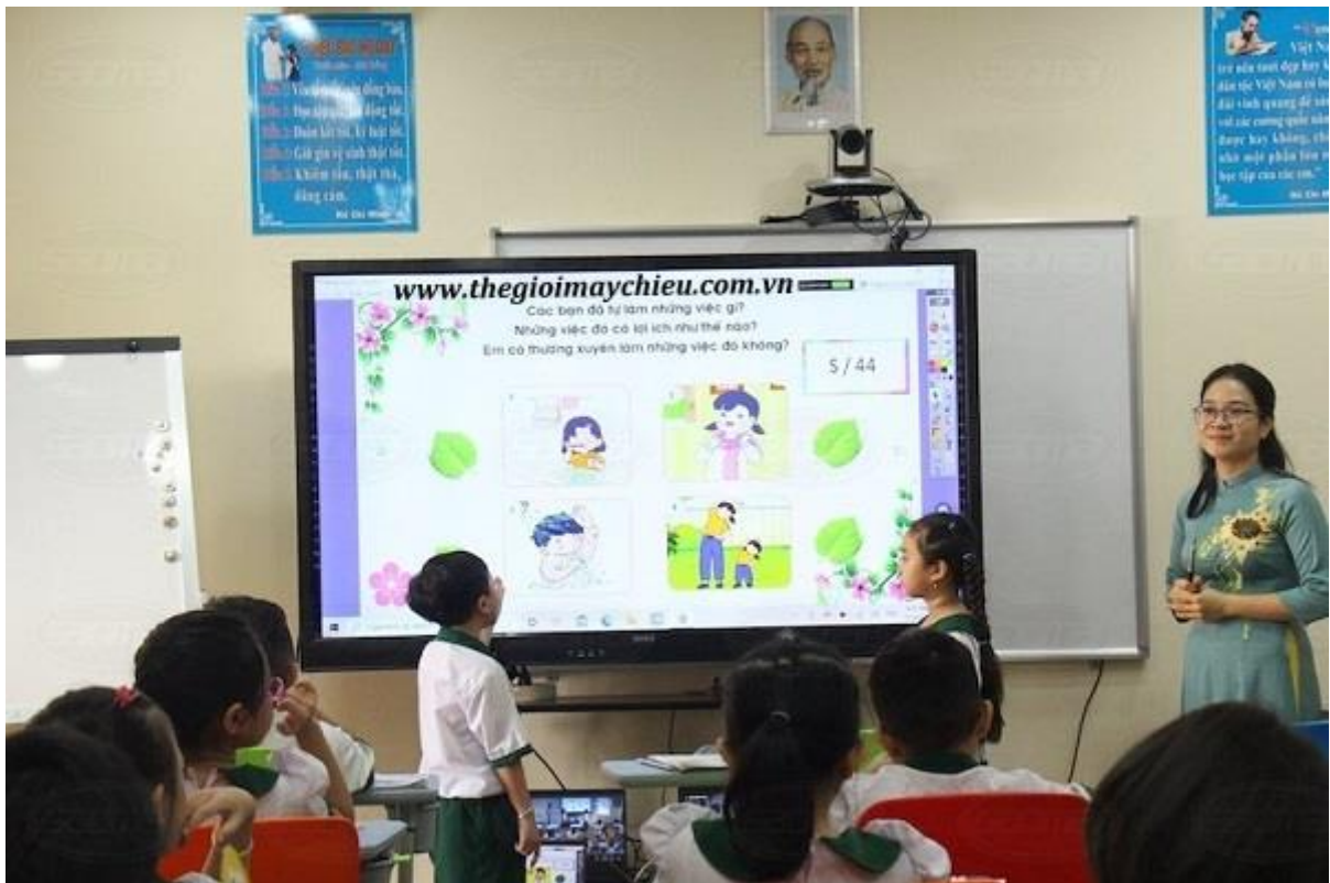
(Ảnh minh họa)

Màn hình tương tác được ứng dụng khá mạnh mẽ trong lĩnh vực giáo dục, doanh nghiệp nhằm tạo ra hiệu quả trong công việc, và dạy học chất lượng nhất!