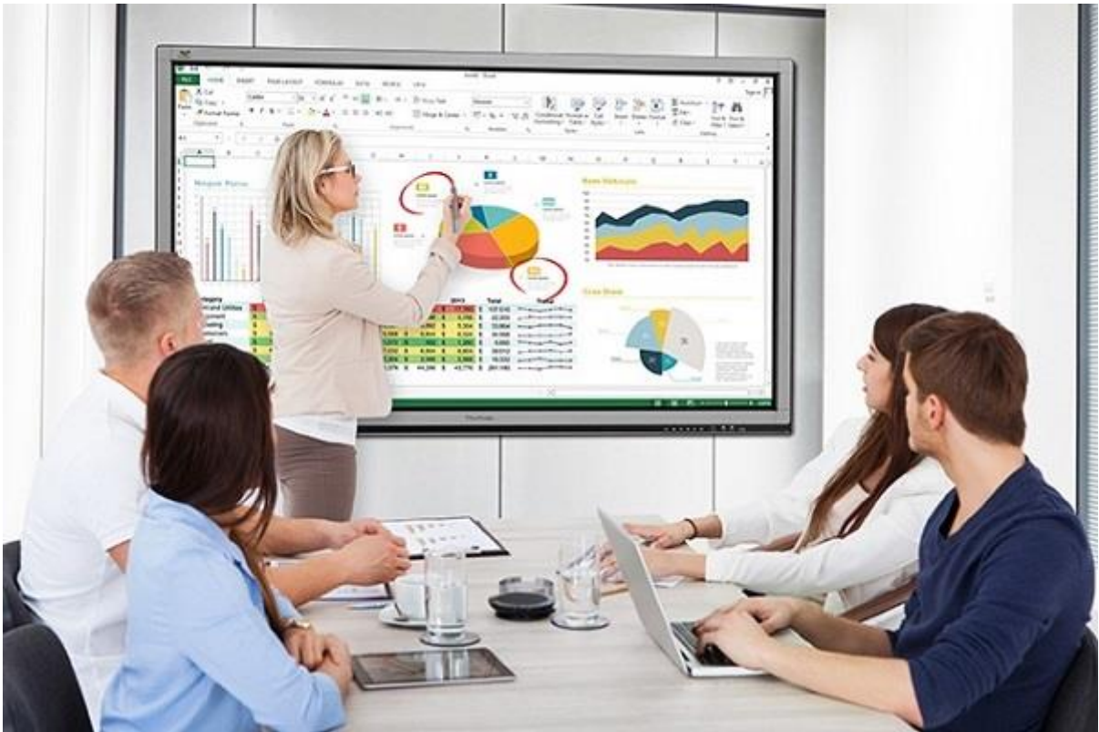
(Ảnh minh hoạ)