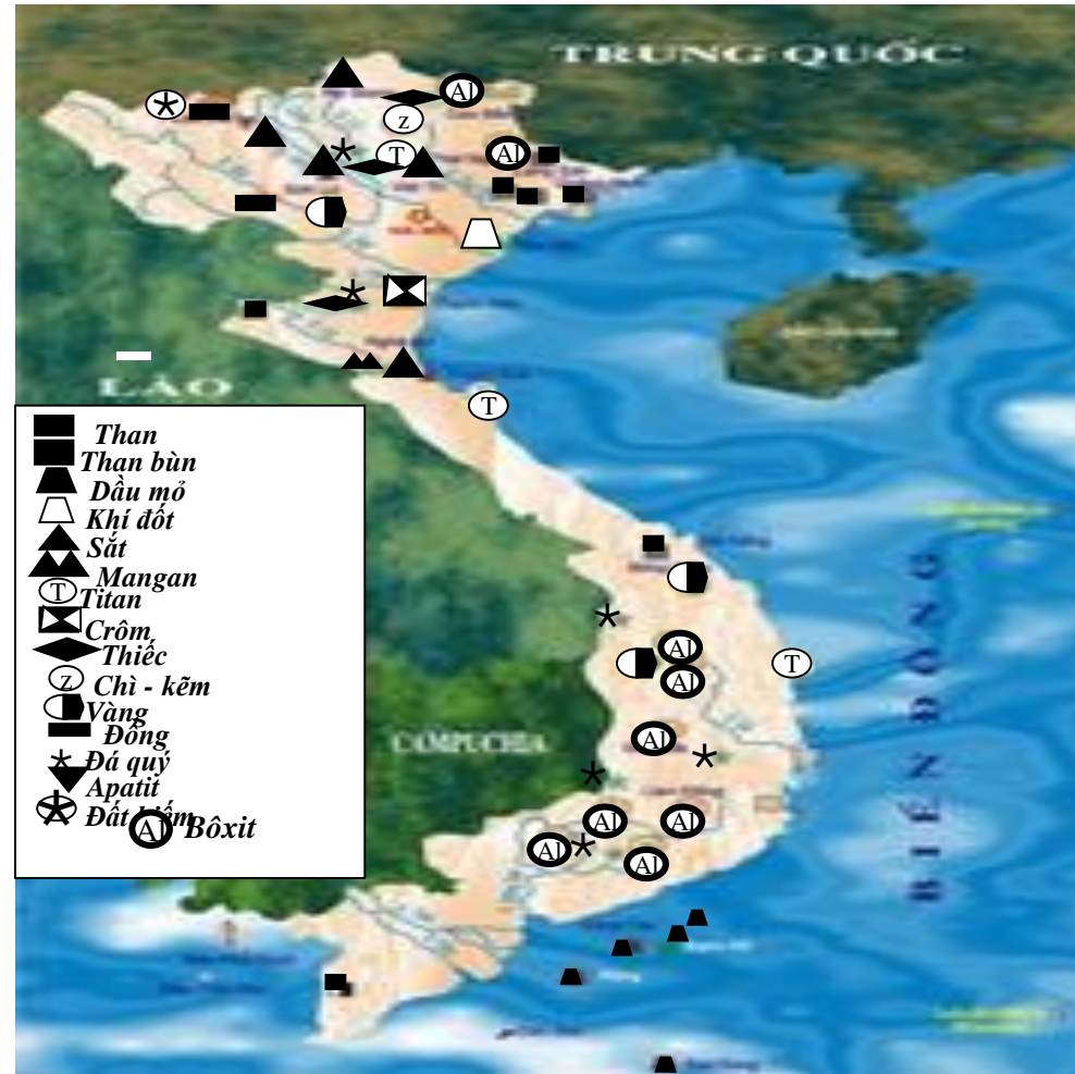
Lược đồ khoáng sản Việt Nam

Quan sát lược đồ nhận xét số lượng và mật độ các mỏ khoáng sản ở nước ta?