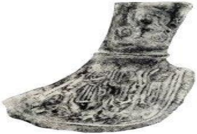
Rìu bằng đồng

- Đó là các công cụ bằng đá, sắt, đồng được phát hiện trong các mộ cổ ở Núi Đọ, Quan Yên (Thanh Hóa) cách đây hàng chục vạn năm - thời kì đồ đá cũ.