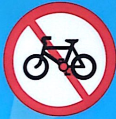
Cấm đi xe đạp