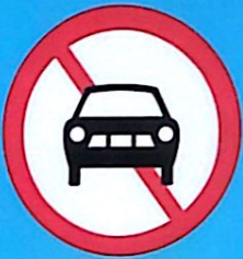
Cấm ô tô

Nhóm biển báo đầu tiên là "Biển báo cấm".