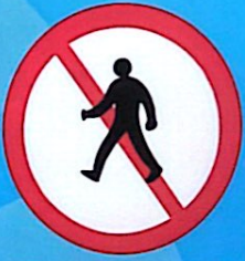
Cấm người đi bộ