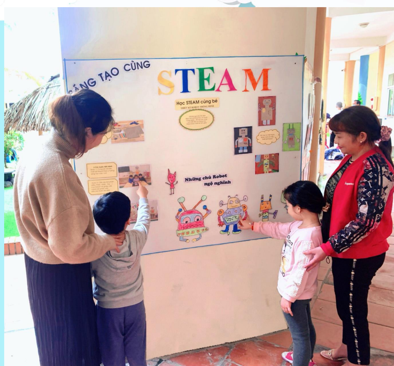
Chia sẻ các thông tin, hoạt động của lớp qua bảng tuyên truyền của lớp