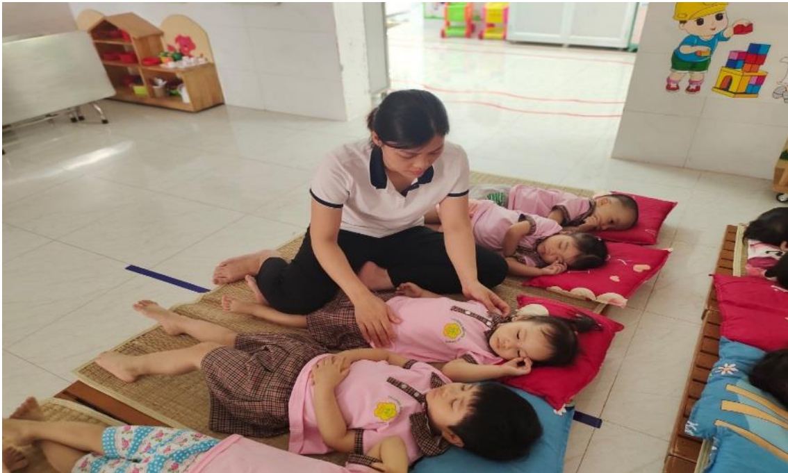
Hình ảnh : Cô chỉnh sửa tư thế nằm, kê lại gối ngay ngắn cho trẻ, vỗ về bên trẻ khó ngủ

Sau giờ ngủ: Trẻ nào thức dậy trước cô cho dậy trước, không đánh thức trẻ, cô kéo dèm từ từ, bật điện phòng ngủ để trẻ tự dậy, sau khi trẻ dậy cô cho trẻ tập một số động tác nhẹ nhàng, cho trẻ giúp cô cất gối.