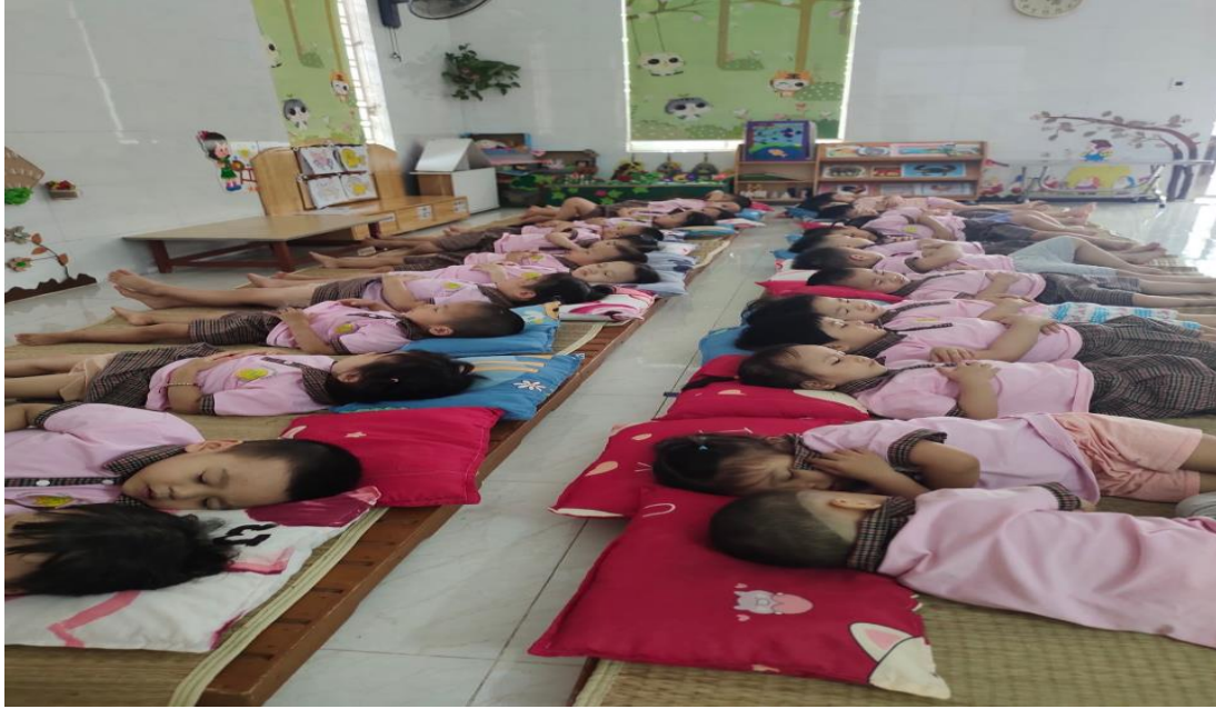
Hình ảnh trẻ ngủ trưa ở lớp

Giờ ngủ trưa của trẻ rất quan trọng, giúp trẻ được nghỉ ngơi một cách đầy đủ, tạo tinh thần thoải mái, cơ thể khỏe mạnh, giúp trẻ tích cực tham gia vào các hoạt động vui chơi, học tập hàng ngày.