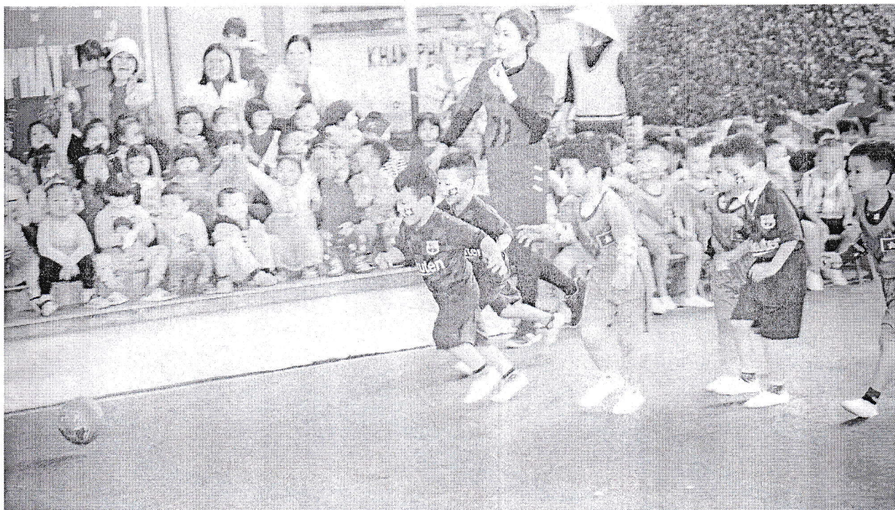
Phần Thi "Đá bóng".

Sân chơi tổ chức đạt mục đích đề ra, đặc biệt huy động và tạo cơ hội cho trẻ ở độ tuổi 4- 5 tuổi được tham gia, trải nghiệm để thành những cầu thủ tí hon phần thi này thu hút được sự cổ động nhiệt tình, phấn khởi của các bé ở các độ tuổi khác và đặc biệt nhận được sự cổ vũ của phụ huynh cùng với cán bộ giáo viên nhân viên trong trường.