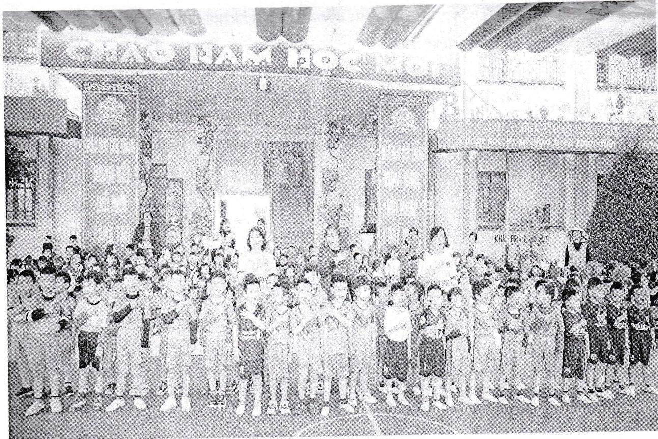
Các bé 4-5 tuổi hát “Quốc ca” chào cờ trước khi ra sân.

Mở đầu chương trình là màn đồng diễn đầy khí thế, nhiều màu sắc rực rỡ của các chiến sĩ đến từ các lớp mẫu giáo 3 tuổi