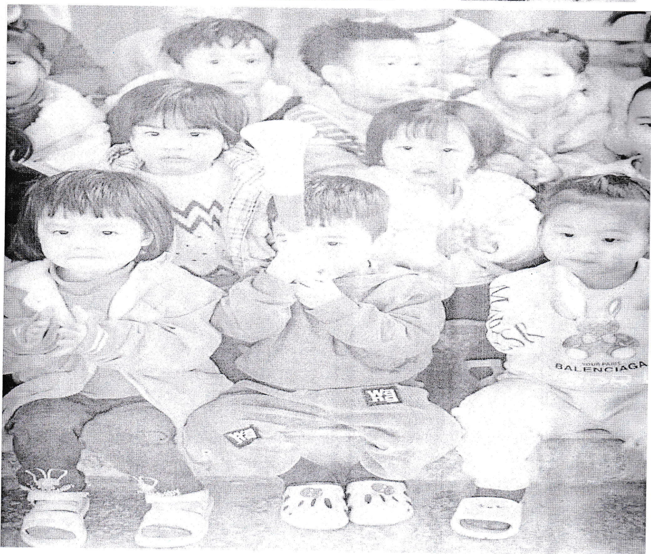
Các cổ động viên thật đáng yêu.