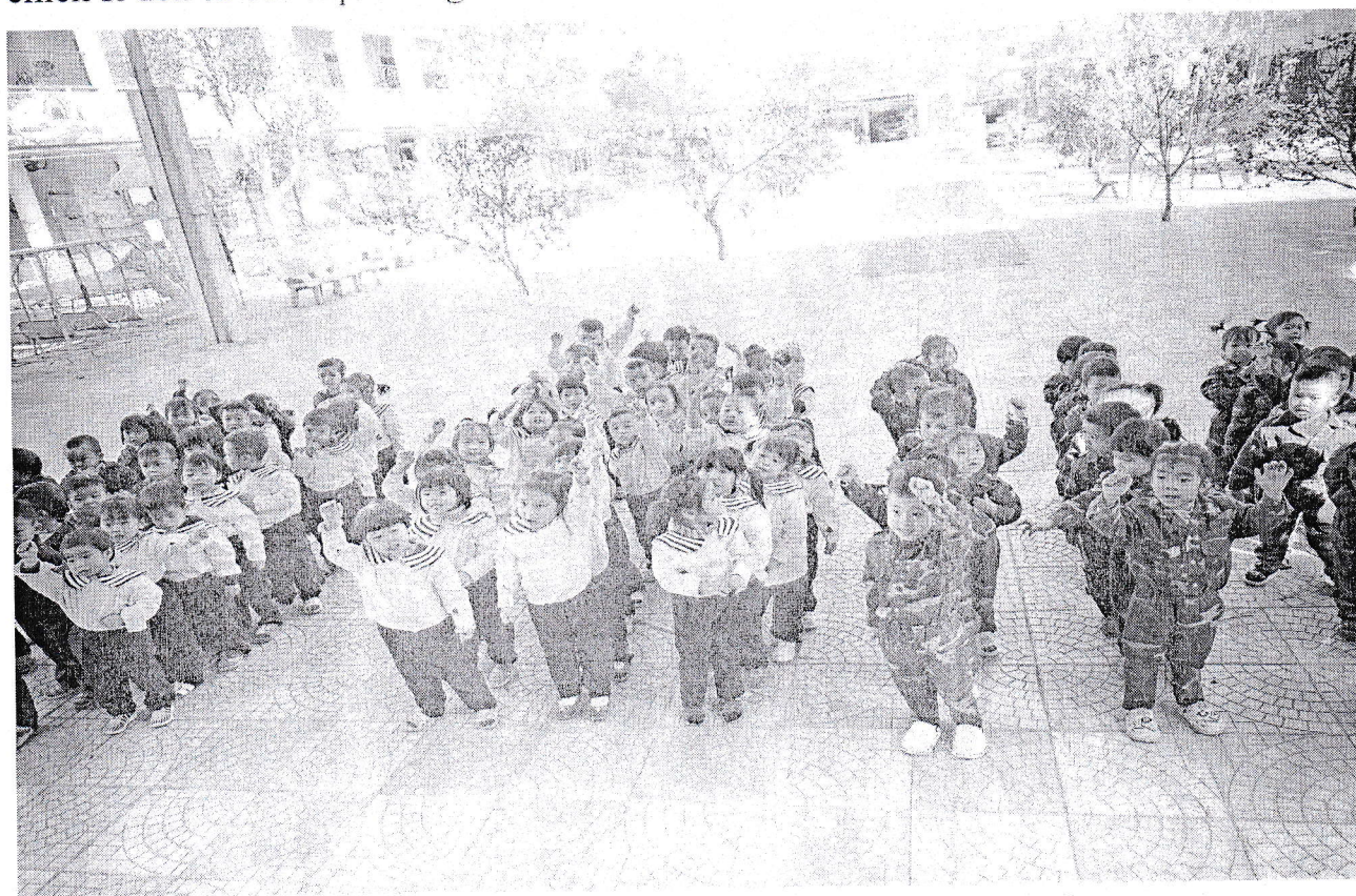
Màn đồng diễn các chiến sĩ khối 3 tuổi

Mở đầu chương trình là màn đồng diễn đầy khí thế, nhiều màu sắc rực rỡ của các chiến sĩ đến từ các lớp mẫu giáo 3 tuổi