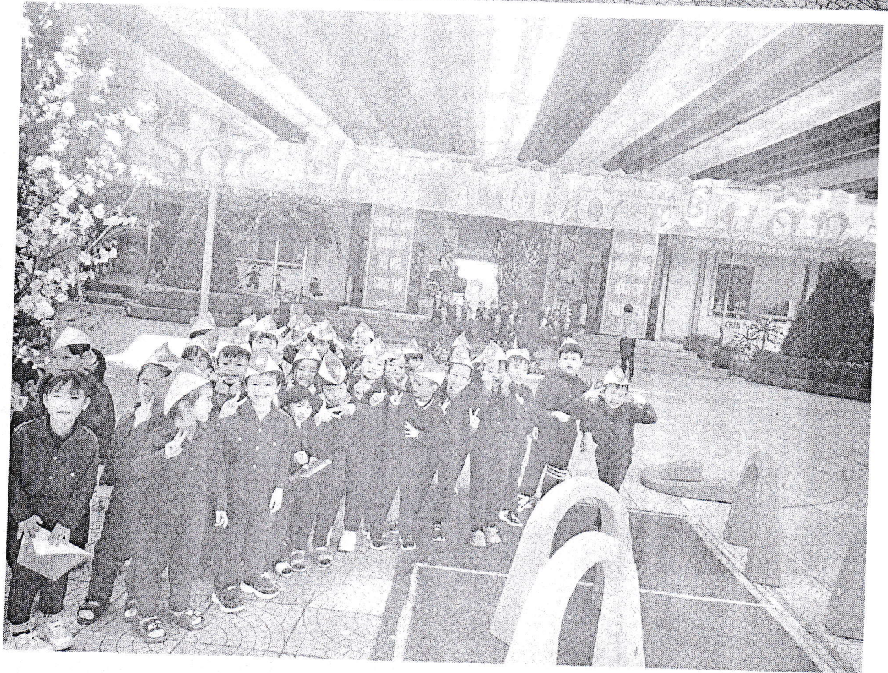
Hình ảnh các chiến sĩ trong bộ trang phục bộ đội