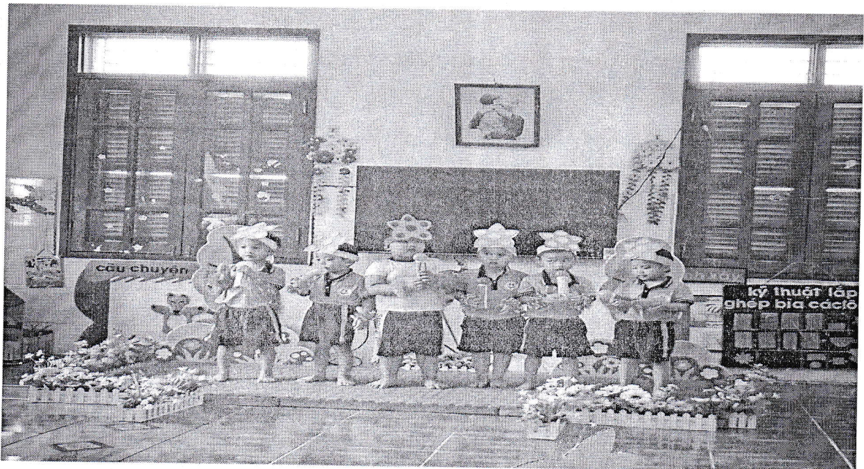
Dạy KN ca hát: Trường chúng cháu là trường Mầm non. Lớp 3B4.