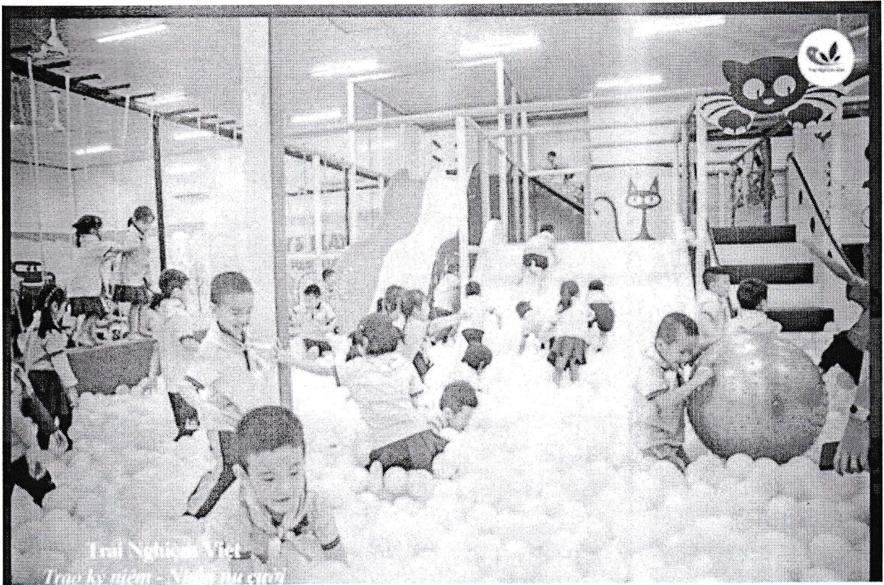
Trẻ được thỏa sức vui chơi trong biển bóng