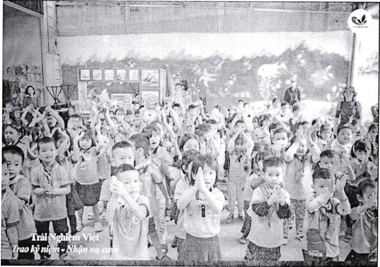
Các bé khởi động trước khi vào chương trình.

Một số hình ảnh kết quả trải nghiệm của trẻ trường mầm non Tiên Thắng tại Thành phố hướng nghiệp: