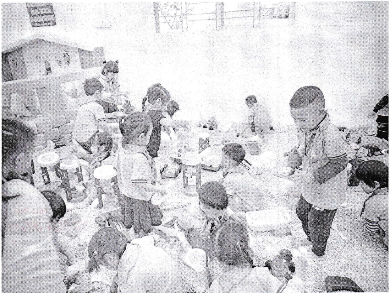
Trẻ tập làm các bác kỹ sư xây dựng