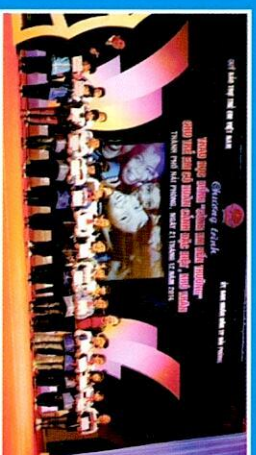
Phó Chủ tịch nước Nguyễn Thị Doan và lãnh đạo Hải Phòng trao học bổng cho trẻ em có hoàn cảnh đặc biệt vươn lên học giỏi!

XIN TRẦN TRONG GÀM ON VÀ TRI ÂN SỰ QUAN TÂM CỦA CÁC CẤP, CÁC NGÀNH VÀ SỰ SẺ CHIA CỦA CÁC NHÀ TÀI TRỢ