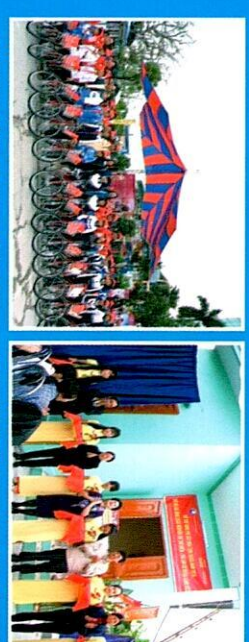
Chương trình tặng xe đạp cho trẻ em có hoàn cảnh đặc biệt!