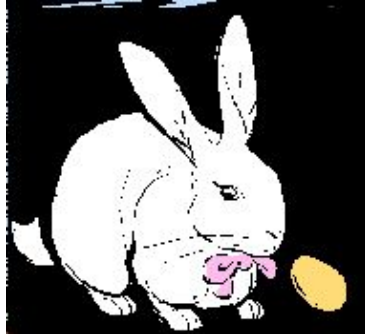
Giải cứu con tôm