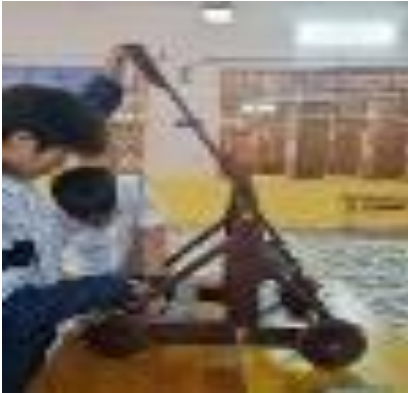
- Nhóm 2