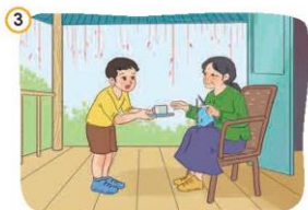
3 Kính trọng, hiếu thảo với ông bà, cha mẹ