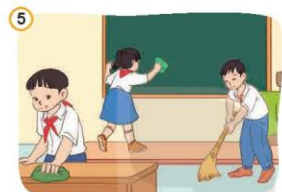
5 Giữ gìn, bảo vệ của công