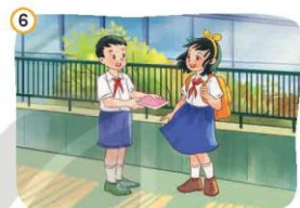
6 Thương yêu, đoàn kết, giúp đỡ bạn bè