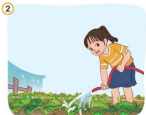
Giúp đỡ bố mẹ những công việc phù hợp