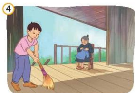
4 Giúp đỡ người có hoàn cảnh khó khăn