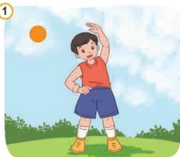
Giữ gìn vệ sinh, rèn luyện thân thể